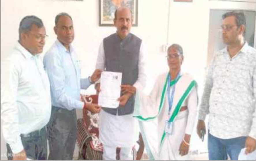
मेट्रो रेज संवाददाता

मैदिनी नगर : विशेष गहन पुनरीक्षण (एसआईआर) 2026 के अंतर्गत पलामू जिले में निर्वाचक निबंधन पदाधिकारियों की