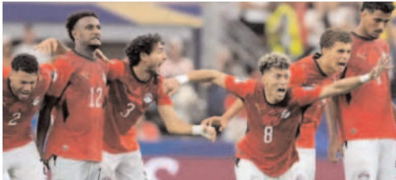
मिश्र का सामना मौजूदा चैंपियन अर्जेंटीना से होगा।