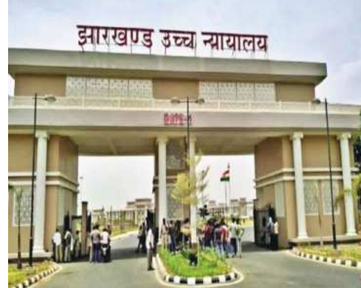
और गवाह संरक्षण की व्यवस्था की जाए। साथ ही तत्काल आर्थिक मुआवजा, पुनर्वास को स्पष्ट नीति बनाकर लागू की जाए। अदालत ने यह भी कहा कि मामले