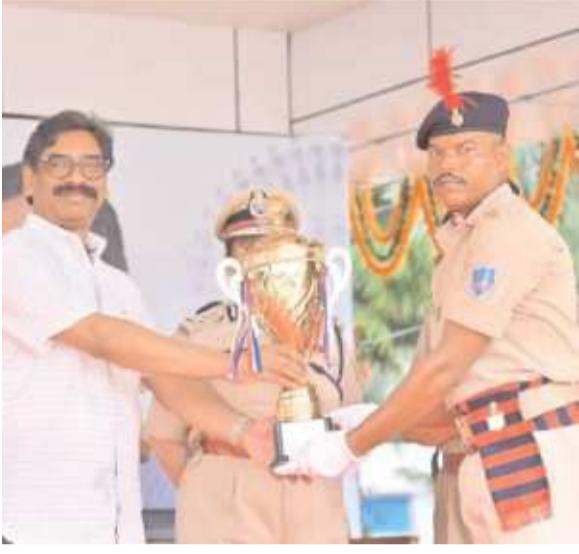
बढ़ाने के लिए राज्य सरकार हर कदम पर उनके साथ खड़ी है।

रांची : पासिंग आउट परेड के दौरान सीएम हेमंत सोरेन ने कहा कि पुलिस बल में आना सिर्फ एक सरकारी नौकरी पाना नहीं है, बल्कि राज्य की सुरक्षा और आम जनता की सेवा का एक बड़ा संकल्प है। वर्दीधारियों की जिम्मेदारी सिर्फ खुद तक सीमित नहीं है। वे अब व्यवस्था का हिस्सा हैं और पूरे राज्य की सुरक्षा के रक्षक हैं। कर्तव्य पथ पर जान का जोखिम भी उठाना पड़ सकता है। सरकारी तंत्र में रहते हुए हर बड़ी चुनौती को झेलना और उसका समाधान निकालना ही मुख्य लक्ष्य होना चाहिए। जवानों का उत्साह