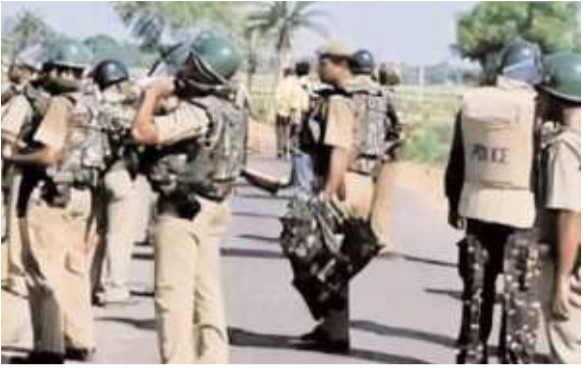
जानकारी के अनुसार केन्द्रीय बलों के जवान 25 जून से 27 जून तक

रांची: झारखंड में मुहर्रम पर्व को शांतिपूर्ण एवं सौहार्दपूर्ण माहौल में संपन्न कराने के लिए राज्य सरकार और प्रशासन ने व्यापक सुरक्षा तैयारियां पूरी कर ली हैं। कानून-व्यवस्था को मजबूत बनाए रखने के उद्देश्य से केन्द्रीय गृह मंत्रालय ने राज्य के विभिन्न संवेदनशील जिलों में केन्द्रीय सुरक्षा बलों की सात कंपनियां तैनात करने की मंजूरी प्रदान की है। प्राप्त