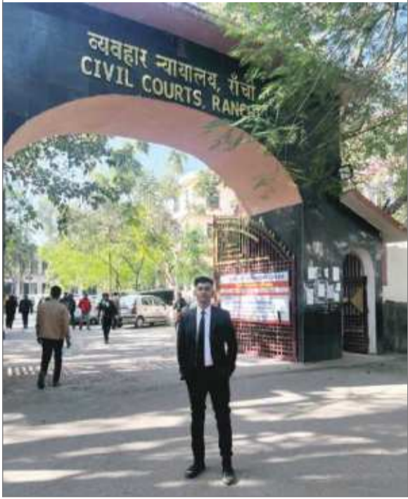
संवाददाता घोटाला मामले में रांची सीबीआई की विशेष अदालत ने बड़ा फैसला सुनाते हुए रांची : अलकतरा (तारकोल)