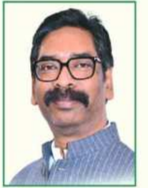
हेमन्त सोरेन मुख्यमंत्री, झारखण्ड