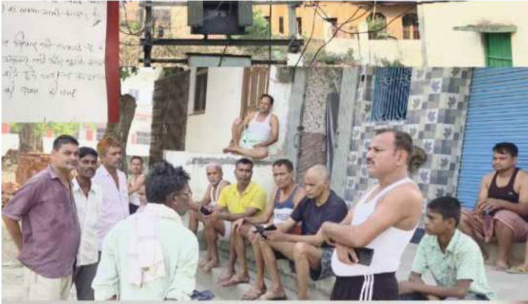
उड़ जा रहा है, जिससे आपूर्ति बहाल नहीं हो पा रही है। स्थानीय लोगों ने कहा कि बिजली संकट के कारण

मेट्रो: जे संवाददाता मैदिनीनगर : हुसैनाबाद शहर के हरिजन स्कूल के पास स्थित ट्रांसफार्मर से पिछले आठ दिनों से विद्युत आपूर्ति पूरी तरह ठप रहने के कारण सैकड़ों परिवार अंधेरे में जीवन यापन करने को मजबूर हैं। भीषण गर्मी के बीच बिजली नहीं रहने से पेयजल संकट गहरा गया है और लोगों का जनजीवन अस्त-व्यस्त हो गया है। स्थानीय लोगों का कहना है कि शहर क्षेत्र में होने के बावजूद आठ दिनों तक समस्या का समाधान नहीं होना विभागीय कार्यशैली पर गंभीर सवाल खड़े करता है। ग्रामीणों और उपभोक्ताओं के अनुसार उन्होंने पहले ही 200 केवीए क्षमता के ट्रांसफार्मर की मांग की थी, लेकिन विभाग ने 100 केवीए का रिपेयर ट्रांसफार्मर उपलब्ध कराया। आरोप है कि अधिक लोड के कारण ट्रांसफार्मर का प्यूज व जमफड़ कुछ ही मिनटों में बार-बार