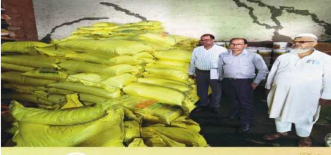
स्थिति दुकान के बाहर प्रदर्शित करने का उर्वरकों की बिक्री केवल किसानों को सख्त निर्देश दिया। साथ ही यह सुनिश्चित करने को कहा गया कि जमाखोरी, कालाबाजारी तथा गैर-कृषि कार्यों में उपयोग पर कड़ी चेतावनी देते हुए कहा गया कि ऐसी गतिविधियों में संलिप्त पाए जाने पर संबंधित व्यक्तियों

संवाददाता साहिबगंज : उपायुक्त के निदेशानुसार उर्वरक दुकानों की जांच हेतु गठित संयुक्त प्रवर्तन दल द्वारा राजमहल प्रखंड स्थित तारा फर्टिलाइजर व विकास कृषि केन्द्र का औचक निरीक्षण किया गया। निरीक्षण के दौरान प्रतिष्ठानों में उपलब्ध उर्वरकों के स्टॉक, दर सूची, स्टॉक पंजी, बिक्री पंजी, गोदाम और पीओएस मशीन के अभिलेखों का गहन परीक्षण किया गया। साथ ही गोदाम में उपलब्ध उर्वरकों का भौतिक सत्यापन भी किया गया। जांच टीम ने दुकानदारों को प्रतिदिन उर्वरकों की दर सूची व स्टॉक की अद्यतन