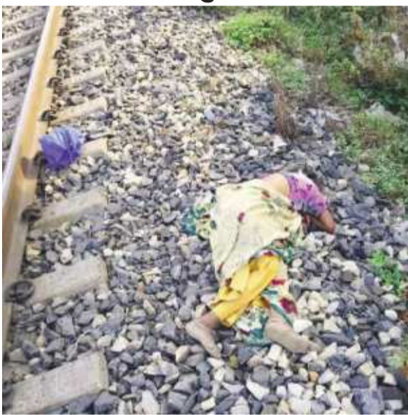
शोक का माहौल है। पुलिस ने आवश्यक कानूनी प्रक्रिया पूरी कर शव को पोस्टमार्टम के लिए भेज दिया है।

मेट्रोरेज संवाददाता मेदिनीनगर : मेदिनीनगर टाउन थाना क्षेत्र के शांतिपुरी इलाके में शुक्रवार सुबह ट्रेन से गिरकर एक वृद्ध महिला की मौत हो गई। घटना की सूचना मिलते ही टीओपी-3 प्रभारी पुलिस बल के साथ मौके पर पहुंचे और शव को अपने कब्जे में लेकर जांच शुरू की।