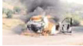
मच गई अफरा-तफरी

गिरिडीह: चलती कार में अचानक आग लग गई। आग ने तुरंत ही विकराल रूप धारण कर लिया। हालांकि आग लगते ही वाहन पर सवार दो लोग कार से बाहर निकलने में सफल रहे। यह घटना गिरिडीह जिले के गावां थाना क्षेत्र अंतर्गत पटनाझडोरंडा मुख्य मार्ग पर बुधवार को हुई है। जानकारी के अनुसार महिंद्रा एक्सयूवी श्री ओ-ओ पर सवार होकर दो लोग गिरिडीह शहर जा रहे थे। कार जैसे ही सांख गांव के पास पहुंची तो कार में शॉट सर्किट होने लगी। शॉट सर्किट से वाहन के अंदर आग लग गई। वाहन के चालक ने तुरंत ही वाहन को बीच सड़क पर खड़ा किया और साथ में बैठे व्यक्ति के साथ बाहर निकल गए। दोनों के बाहर आते ही कार धू-धुकर जलने लगी और आग ने विकराल रूप धारण कर लिया।