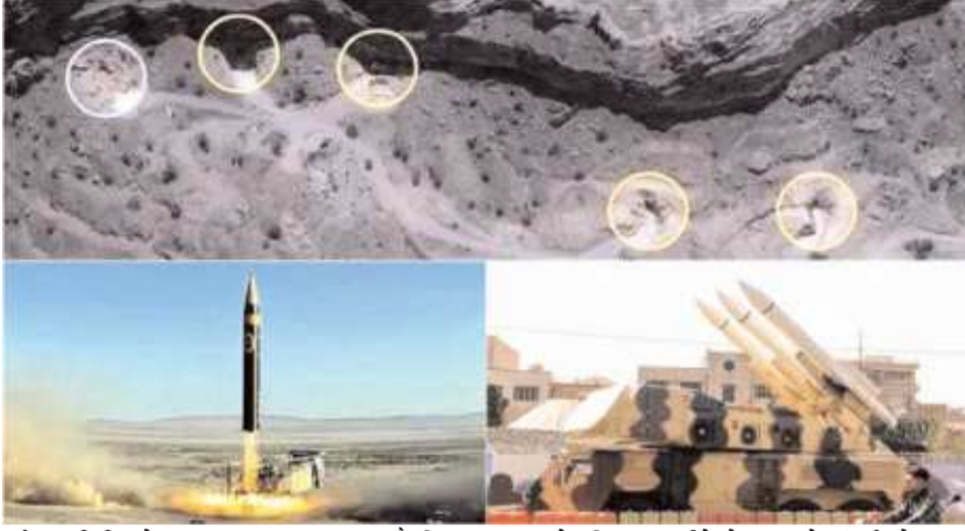
आईआरजीसी) ने गुरुवार सुबह कहा कि अमेरिकी हमलों के बाद उसने कुवैत और बहरीन में अमेरिकी टिकानों पर हमला किया। अमेरिकी मध्य कमान का

तेहरान/वाशिंगटन/ कुवैत सिटी/ मनामा : अमेरिका ने ईरान को दिन में तारे दिखा दिए हैं। अमेरिका की सेना इस समय भी ईरान पर मिसाइल और ड्रोन से से हमले कर रही है। ईरान ने भी होर्मुज जलडमरूमध्य को बंद करने हुए अमेरिका के साथी देशों बहरीन और कुवैत पर हमले शुरू कर दिए हैं। इससे समूचे मध्य पूर्व में सैन्य तनाव चरम पर पहुंच गया है। गल्फ न्यूज, अल जजीरा और सीबीएस न्यूज की रिपोर्ट के अनुसार, अमेरिका ने ईरान पर फिर हमले किए हैं। तेहरान का कहना है कि उसने होर्मुज जलडमरूमध्य को बंद कर दिया है। ईरान के इस्लामिक रिवोल्यूशनरी गार्ड कॉर्प्स (