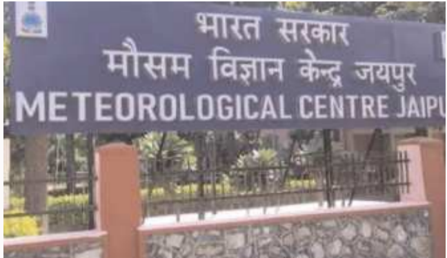
बढ़ोतरी हुई। राजधानी जयपुर में बुधवार को मौसम साफ रहा और तापमान 36.6 डिग्री सेल्सियस रहा, जो एक दिन पहले की तुलना में करीब दो डिग्री अधिक रहा। हालांकि वातावरण

जताई गई है। वहीं भरतपुर और धौलपुर जिलों में बारिश और तेज हवाओं का येलो अलर्ट जारी किया गया है। पिछले 24 घंटों में प्रदेश का सबसे अधिक तापमान फलोदी में 42.8 डिग्री सेल्सियस मापा गया। जैसलमेर में 42.2 डिग्री तापमान रिकॉर्ड हुआ। इसके अलावा बाड़मेर में 41.8, पाली में 40.3, बीकानेर में 40.2 और जोधपुर में 40.3 डिग्री सेल्सियस तापमान रहा। जैसलमेर, जोधपुर और बाड़मेर क्षेत्रों में दिनभर हल्की धूलभरी हवाएं चलती रहीं। धूप तेज रहने के कारण कई शहरों में तापमान में करीब तीन डिग्री तक की