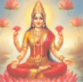
सुख-समृद्धि प्राप्त होती है।

चु हिंदू धर्म में शुक्रवार का दिन विशेष रूप से मां लक्ष्मी की समर्पित होता है। यह दिन मां लक्ष्मी की पूजा-आराधना के लिए समर्पित होता है। मां लक्ष्मी की कृपा होने पर जातक को कभी आर्थिक तंगी नहीं होती है। वहीं जातक के जीवन में सुख-समृद्धि और सौभाग्य की प्राप्ति होती है। वहीं आप पूजा के समय मां लक्ष्मी के कुछ मंत्रों का जाप करके उनकी कृपा और आशीर्वाद प्राप्त कर सकते हैं। वहीं इन मंत्रों का जाप करने से दरिद्रता दूर होती है। ऐसे में आज इस आर्टिकल के जरिए हम आपको मां लक्ष्मी के प्रभावशाली मंत्रों के बारे में बताते जा रहे हैं, जिनका जाप करने से