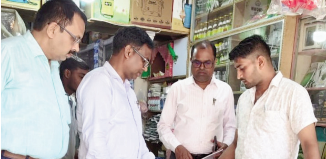
जानकारी दुकान के बाहर प्रदर्शित करने का निर्देश दिया। इसके अतिरिक्त केवल सरकार द्वारा अधिकृत थोक विक्रेताओं से

साहिबगंज : किसानों को गुणवत्तापूर्ण उर्वरक एवं कृषि आदान की उपलब्धता सुनिश्चित करने तथा उर्वरकों की कालाबाजारी पर प्रभावी नियंत्रण के उद्देश्य से उपायुक्त साहिबगंज के निदेशानुसार गठित संयुक्त प्रवर्तन दल द्वारा बरहेट प्रखंड के विभिन्न उर्वरक प्रतिष्ठानों का औचक निरीक्षण किया गया। निरीक्षण के दौरान साह कृषि केन्द्र, राजकुमार डोकानिया एवं मोदी फर्टिलाइजर सहित तीन प्रतिष्ठानों में स्टॉक सूची, दर तालिका, उर्वरक स्टॉक पंजी बिक्री पंजी गोदाम और पीओएस मशीन में उपलब्ध अभिलेखों का गहन सत्यापन किया गया। साथ ही गोदाम में उपलब्ध उर्वरकों का भौतिक सत्यापन कर अभिलेखों से मिलान किया गया। संयुक्त प्रवर्तन दल ने सभी दुकानदारों को प्रतिदिन अद्यतन दर सूची व उपलब्ध स्टॉक की