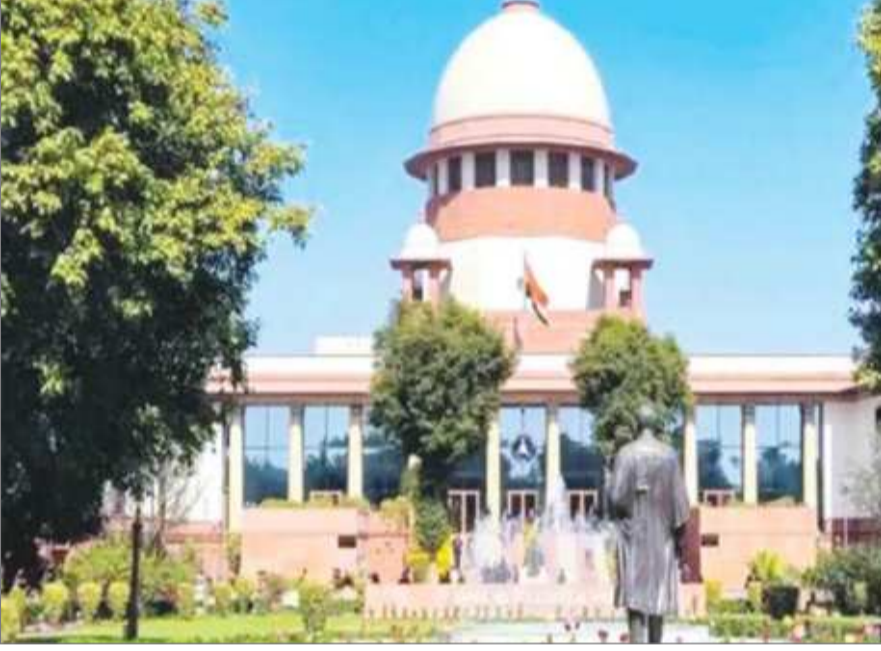
और कानूनी कार्यवाही को रद्द करने से इनकार कर दिया था। हाईकोर्ट का मानना था कि प्रथम आरोप सही प्रतीत होते हैं, जिसके बाद ससुराल वालों ने न्याय के लिए सुप्रीम कोर्ट का दरवाजा खटखटाया।