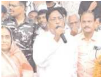
बड़ी संख्या में मौजूद समर्थकों और कांग्रेस