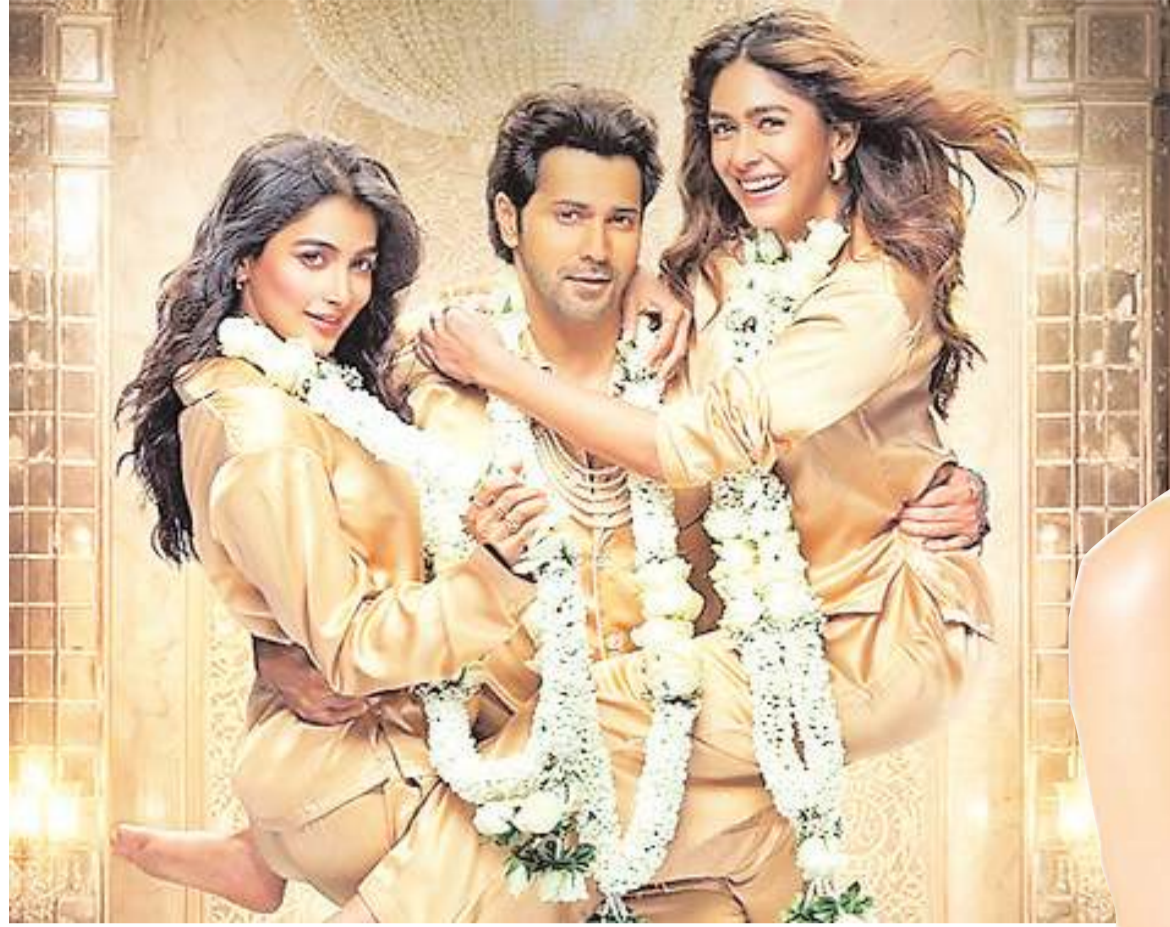
रोमांस और एंटरटेनमेंट से भरपूर होगी फिल्म