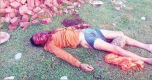
मेट्रो रेज संवाददाता

मेदिनी नगर : हरिहरगंज थाना क्षेत्र के वैद्य विगहा गांव स्थित आंगनवाड़ी केंद्र के पीछे खाली पड़े खेत से शनिवार सुबह 35 से 40 वर्ष के एक अज्ञात व्यक्ति का शव बरामद होने से इलाके में सनसनी फैल गई। आशंका जताई जा रही है कि अपराधियों ने तेज धारदार हथियार और ईंट से हमला कर हत्या करने के बाद शव को खेत में फेंक दिया। ग्रामीणों की सूचना पर पहुंची पुलिस ने शव को कब्जे में लेकर पहचान कराने का प्रयास किया, लेकिन पहचान नहीं हो सकी। आवश्यक कानूनी प्रक्रिया