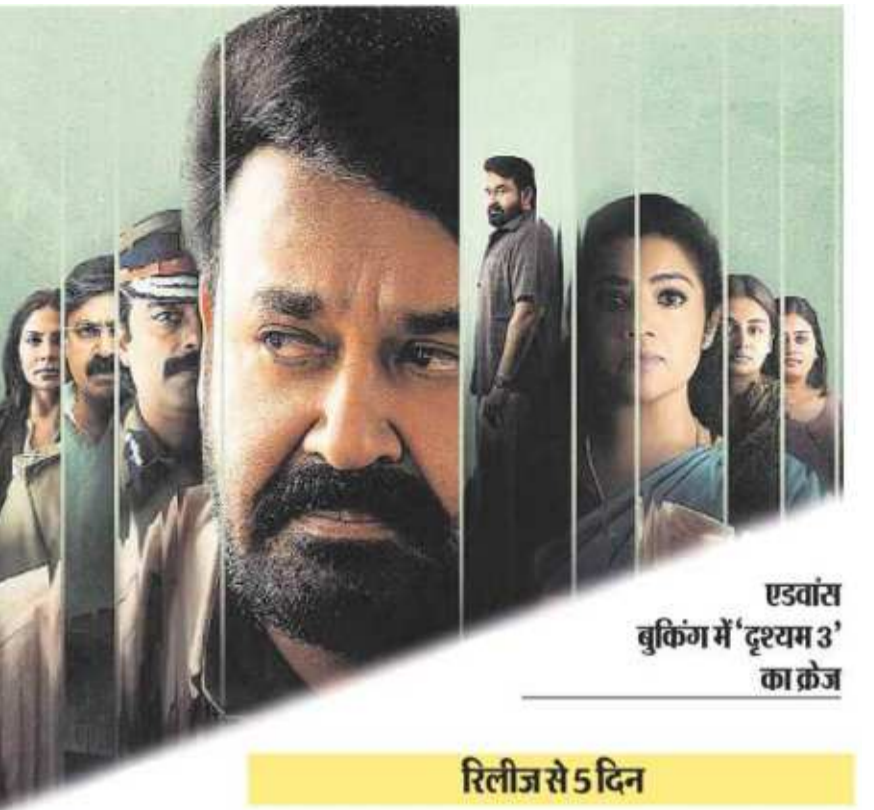
एडवॉंस बुकिंग में 'दृश्यम 3' का क्रेज