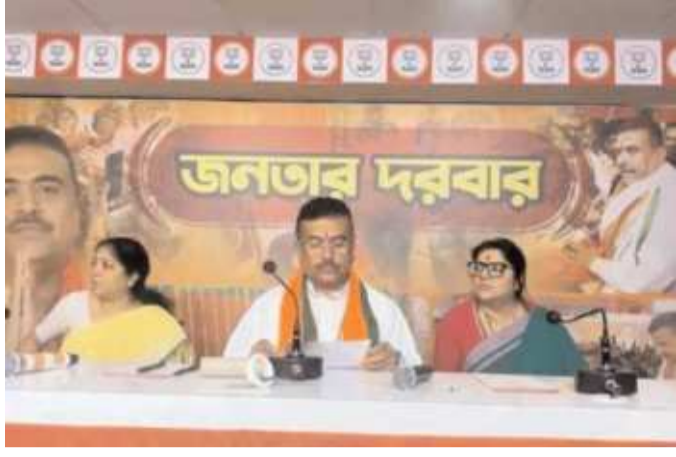
महत्वपूर्ण प्रशासनिक बैठकें निर्धारित हैं। सूत्रों के मुताबिक, सोमवार को होने वाली मंत्रिमंडल की बैठक में आरजी कर प्रकरण, महिलाओं के खिलाफ अपराध, संस्थागत भ्रष्टाचार, वेतन आयोग और सरकारी कर्मचारियों के लंबित महंगाई भत्ते जैसे अहम मुद्दों पर चर्चा हो सकती है। इसके अलावा सीमा सुरक्षा बल को जमीन हस्तांतरण सहित कई प्रशासनिक विषयों पर भी बैठक होने की संभावना है।