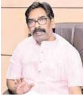
सहायक आचार्य के पदों पर जिन अभ्यर्थियों को नियुक्ति पत्र दिया जाना है, उनमें 158

रांची: मुख्यमंत्री हेमंत सोरेन सोमवार को सहायक आचार्य के पद पर नियुक्त 319 अभ्यर्थियों को नियुक्ति पत्र सौंपेंगे। साथ ही महिला एवं बाल विकास तथा सामाजिक सुरक्षा विभाग के लिए नियुक्त महिला पर्यवेक्षक के पदों पर नियुक्त 19 अभ्यर्थियों को भी नियुक्ति पत्र देंगे। इसे लेकर प्रोजेक्ट भवन सभागार में नियुक्ति पत्र वितरण समारोह का आयोजन किया गया है।