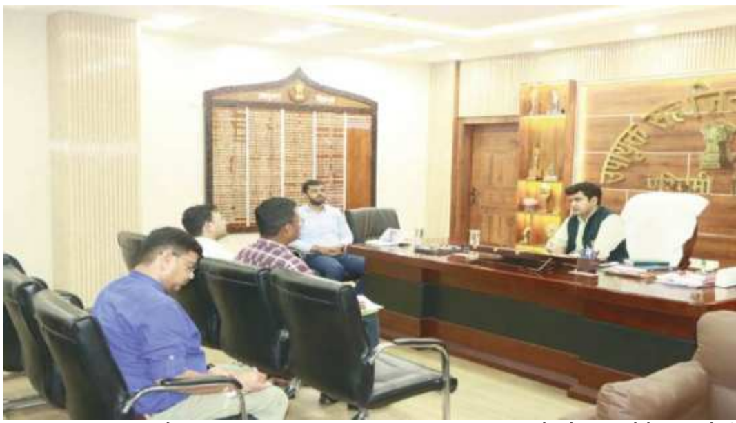
उत्पादन एवं फास्ट फूड से संबंधित प्रशिक्षण करना सुनिश्चित किया जाए, ताकि जेल से बाहर आने के उपरांत वो भी