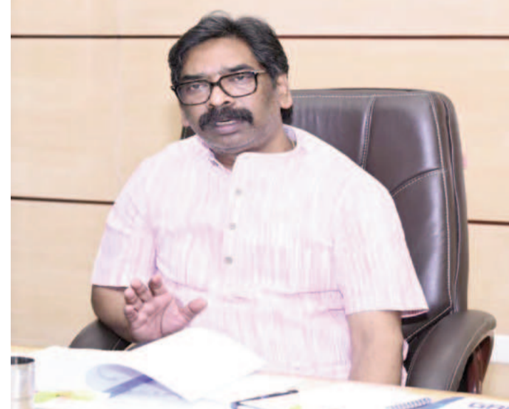
परंपराओं और आस्था का जिक्र करते हुए पद्धति, प्रकृति पूजन, ग्राम देवता और कहा कि सरना धर्म की अपनी अलग पूजा पारंपरिक रीति-रिवाज हैं, जो इसे एक

समाज के विकास पर असर पड़ सकता है। राज्यपाल संतोष कुमार गंगवार को पत्र लिखकर आगामी जनगणना के दूसरे चरण में आदिवासी/सरना धर्म (अथवा अन्य सशुभ धार्मिक व्यवस्था) को अलग कोड देते हुए समाज को पुथक पहचान प्रदान किए जाने के संबंध में राज्य की जनभावनाओं, झारखण्ड विधानसभा के संकल्प तथा आदिवासी समाज को पहचान देने की बात कही। उन्होंने यह भी बताया कि झारखंड सरकार जनगणना प्रक्रिया में पूरी तरह सहयोग कर रही है और खुद उन्होंने भी सेल्फ एन्यूमरेशन में हिस्सा लिया है लेकिन इस दौरान यह बात सामने आई कि धर्म से जुड़े आंकड़े दूसरे चरण में जुटाए जाएंगे। इसी को देखते हुए उन्होंने फिर से सरना धर्म के लिए अलग कोड की मांग दोहराई है। सरना धर्म की है विशिष्ट पहचान: मुख्यमंत्री ने पत्र में आदिवासी समाज की