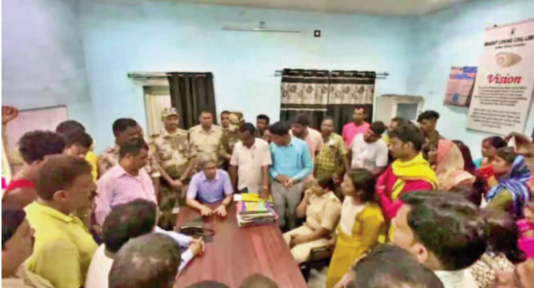
संस्कार के लिए 75 हजार रुपये अलग से दिए जाएंगे। परिजनों को राहत देने के लिए एक और अहम फैसला लिया गया है, हर प्रभावित परिवार के एक सदस्य को मुनीडीह वाशरी की आउटसोर्सिंग में नौकरी दी जाएगी। इसके अलावा बच्चों की पढ़ाई के लिए उच्च स्तर में नामांकन के लिए भी मदद की जाएगी।

संवाददाता धनबाद : बीसीसीएल के मुनीडीह स्थित भारत कोकिंग कोल लिमिटेड की वाशरी में शनिवार को हुए हादसे में चार मजदूरों की जान चली गई थी। स्लरी (कोयले का गीला कचरा) लोडिंग के दौरान यह हादसा हुआ था। हादसे के बाद आक्रोशित परिजन और यूनियन नेता शव को वाशरी गेट पर रखकर मुआवजे और नौकरी की मांग पर अड़े रहे। देर रात से लेकर सुबह करीब 4 बजे तक चली मैराथन वार्ता के बाद बीसीसीएल प्रबंधन और यूनियन के बीच सहमति बन गई। आश्रितों को 20-20 लाख रुपये की आर्थिक सहायता समझौते के तहत सभी मृतकों के आश्रितों को कुल 20-20 लाख रुपये की आर्थिक सहायता दी जाएगी। इसमें 10 लाख रुपये 10 दिनों के भीतर और बाकी के 10 लाख रुपये 20 दिनों के अंदर देने का आश्वासन दिया गया है। साथ ही अंतिम