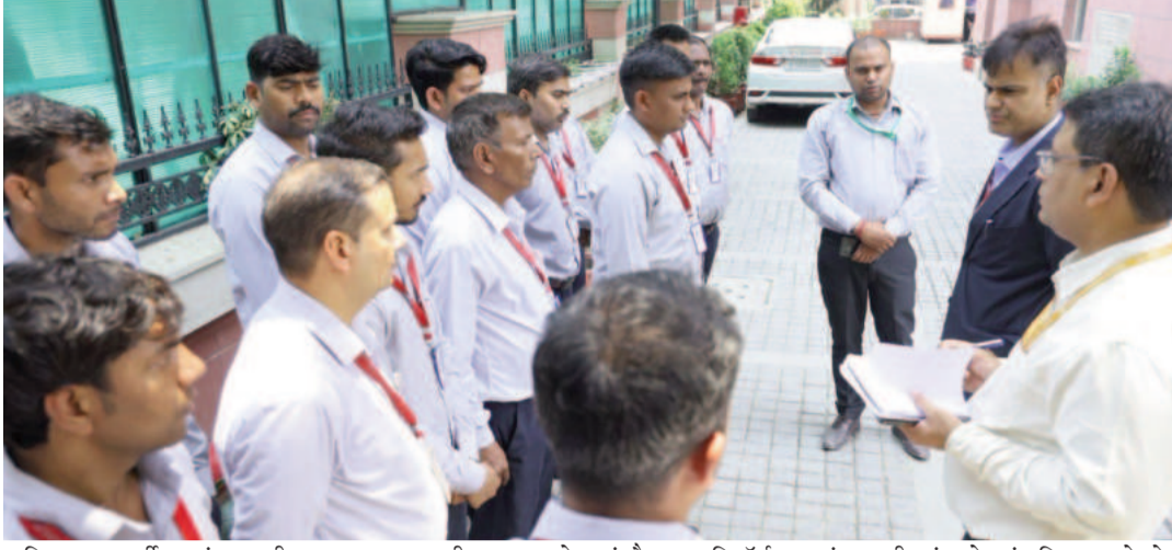
अधिक पारदर्शी एवं तकनीक-सक्षम बनाने हेतु इलेक्ट्रॉनिक मॉड्यूल एवं डिजिटल मॉनिटरिंग सिस्टम लागू करने पर बल दिया। ऑनलाइन फीडबैक प्रणाली शुरू करने एवं मैनुअल रिकॉर्ड को नियमित रूप से अपडेट रखने, शौचालय व्यवस्था को सुदृढ़ बनाए रखने एवं कूड़ा-कचरा प्रबंधन को व्यवस्थित एवं प्रभावी ढंग से संचालित करने के सख्त निर्देश भी दिए। निरीक्षण के दौरान उन्होंने कर्मचारियों से सीधा संवाद स्थापित कर उनकी

बिनीय मिश्रा झारखंड सरकार के रेजिडेंट कमिश्नर अरवा राजकमल ने न्यू झारखंड भवन का विस्तृत औचक निरीक्षण कर समग्र व्यवस्थाओं की गहन समीक्षा की। निरीक्षण के दौरान भवन की मॉडर्नेस, हाउसकीपिंग, रसोई संचालन, कर्मचारियों की उपस्थिति विवरणों, कर्मचारियों की कार्यप्रणाली का भौतिक सत्यापन किया गया। उन्होंने अधिकारियों को न्यू झारखंड भवन को बेहतर प्रशासनिक समन्वय एवं जनसुविधाओं के मॉडल केंद्र के रूप में विकसित करने के निर्देश दिए। साथ ही, कर्मचारियों का सुव्यवस्थित विवरण संघारित करने, प्रशासनिक प्रक्रियाओं को