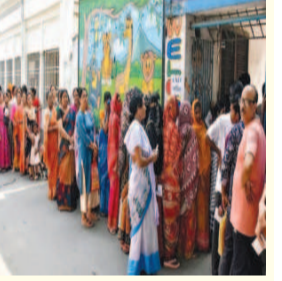
कड़े इंतजाम किए गए हैं।

कोलकाता : पश्चिम बंगाल में सियासी घारा हाई है। दो चरणों की वोटिंग के बाद पार्टियों अपनी-अपनी जीत का दावा कर रही हैं, तो इस बीच आज पश्चिम बंगाल में 15 बूथों पर दोबारा मतदान कराया जा रहा है। चुनाव आयोग ने साउथ परगना जिले की मगराहाट वेस्ट और डायमंड हार्बर, इन दोनों सीटों के 15 मतदान केंद्रों पर फिर से मतदान कराने का आदेश दिया है। जहां मगराहाट वेस्ट के 11 और डायमंड हार्बर के 4 पोलिंग बूथों पर आज फिर वोट डाले जा रहे हैं। बता दें प। बंगाल समेत 5 राज्यों में हुए विधानसभा चुनावों के नतीजे 4 मई को आएंगे। दरअसल, चुनाव आयोग को 77 पोलिंग सेंटर्स पर री-पोल कराने की रिक्वेस्ट मिली थी। आरोप था कि कुछ बूथों पर ईवीएम से छेड़छाड़ की गई है और कुछ जगह ईवीएम में गड़बड़ी की शिकायत थी, जिसे लेकर इलेक्शन ऑब्जर्वर्स की रिपोर्ट आने के बाद चुनाव आयोग ने साउथ परगना जिले की 2 सीटों पर फिर से मतदान कराने का आदेश दिया। इन 15 बूथों पर सुबह 7 बजे से शाम 6 बजे तक वोटिंग जारी रहेगी। इस बीच किसी भी अप्रिय घटना की आशंका को देखते हुए सुरक्षा के कड़े इंतजाम किए गए हैं।