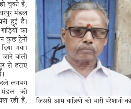
जिससे आम यात्रियों को भारी परेशानी का