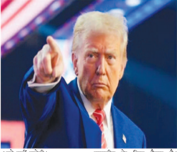
आगे नहीं बढ़ेगी।

जंग रोकने का ईरानी ऑफर फिर टुकराया, इसमें परमाणु मुद्दे का जिक्र नहीं था 'पहला निशाना इजरायल, अगला अमेरिका होगा'