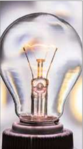
4.25 रुपये प्रति यूनिट हो गई है। हालांकि यह राहत काफी सीमित मानी जा रही है। व्यवसायिक उपभोक्ताओं पर

रांची : झारखंड में दामोदर वैली कारपोरेशन (डीवीसी) क्षेत्र के लिए नए बिजली टैरिफ लागू हो गए हैं। एक अप्रैल से प्रभावी इस नए आदेश में पुराने वर्षों का हिसाब, मौजूदा दरों की समीक्षा और आने वाले वर्षों की योजना सब कुछ शामिल किया गया है। नई दरों का असर सीधे उपभोक्ताओं की जेब पर दिखेगा, खासकर उद्योग और व्यापार से जुड़े लोगों पर।