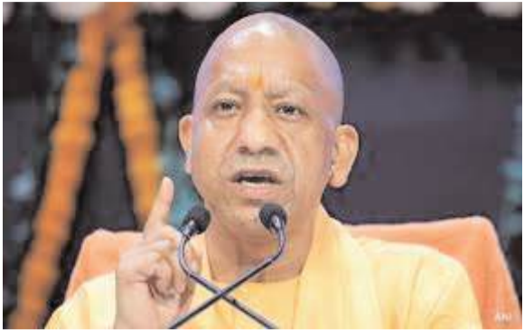
हुआ करती थी, लेकिन सुविधाओं, संसाधनों और तकनीक के अभाव में धीरे धीरे ज्यादातर लोग इस काम को छोड़ते

के वस्त्र उद्योग को विकसित करने को लेकर कुछ समय पहले प्रयास शुरू किए गए थे। इस प्रयास के अंतर्गत स्थानीय स्तर पर एक डायमोनोस्टिक स्टडी रिपोर्ट तैयार की गई थी। बुनकरों से बातचीत कर यह जानने की कोशिश हुई थी कि किन समस्याओं के कारण और किन सुविधाओं की कमी से इस काम में दिक्कतें आनी शुरू हुईं। यह रिपोर्ट एक एक्सपर्ट संस्था ने विभिन्न स्टेकहोल्डर्स से बातचीत और वेसलाइन सर्वे कर तैयार की थी। रानीपुर, मऊरानीपुर, उल्दन और आसपास के क्षेत्रों में किसी समय में बुनकरों की बड़ी संख्या