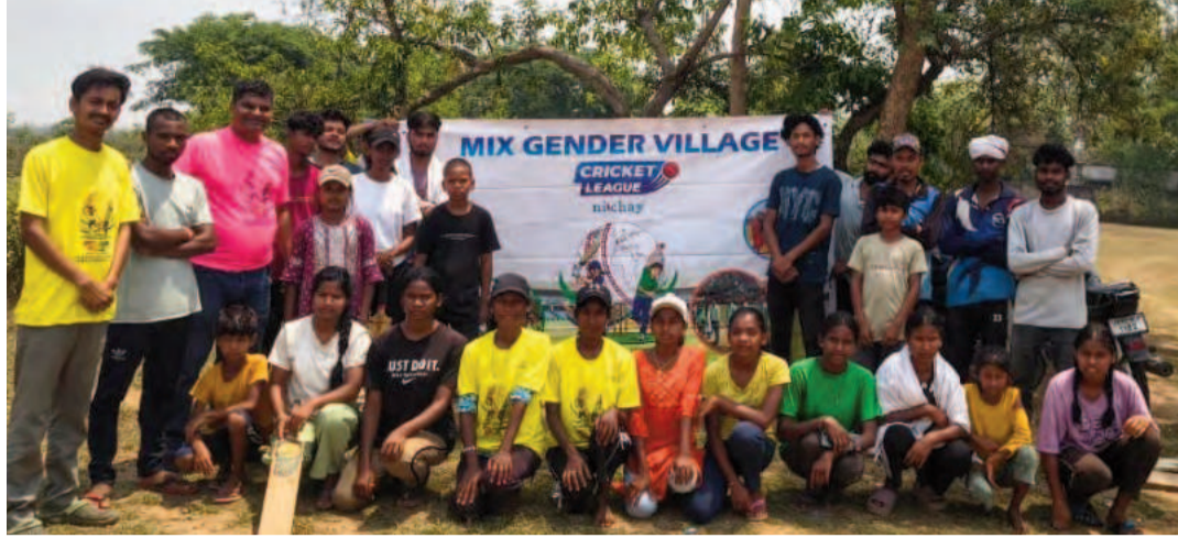
टूर्नामेंट खेला गया।