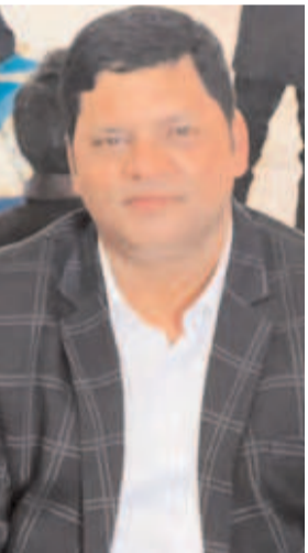
अधीक्षक (एसएसपी), सदर अनुमंडल पदाधिकारी तथा