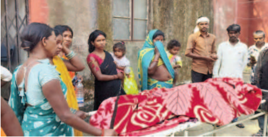
चला इसके बाद दहेज में बाइक मांग करने लगे, नहीं देने पर पुत्री के साथ मारपीट व प्रताड़ित