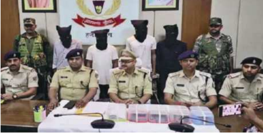
पुलिस ने चार सदस्यों को घेराबंदी कर गिरफ्तार कर लिया।