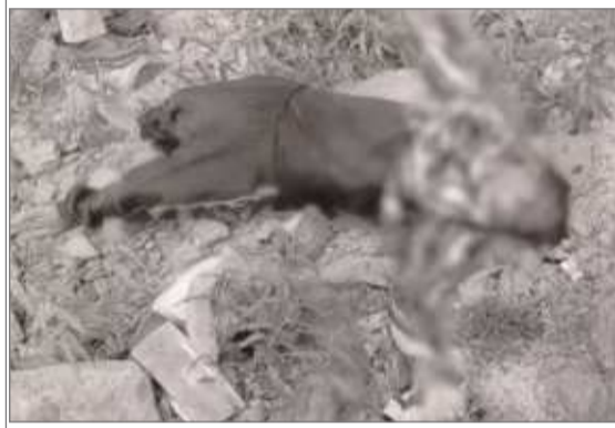
अज्ञात शव बरामद

रांची: कर्क शाना क्षेत्र में जुमार नदी से एक अज्ञात व्यक्ति का शव बरामद, पुलिस ने शव को कब्जे में लेकर पोस्टमार्टम के लिए भेजा। मामले की जांच जारी है।