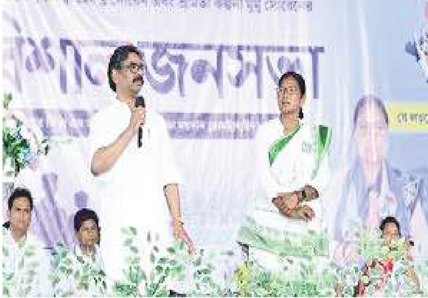
सोरेन ने झारग्राम में प्रस्तावित जनसभा की अनुमति नहीं मिलने पर भी कड़ी आपत्ति जताई। उन्होंने कहा कि 19 अप्रैल को उन्हें झारग्राम में सभा की अनुमति नहीं दी गई, जिससे वे वहां नहीं

कि बंगाल की जनता अपनी संस्कृति, अस्मिता और सामाजिक पहचान की रक्षा के लिए मतदान करेगी। हेमंत सोरेन ने कहा कि बंगाल के लोग भाजपा की राजनीति और उसके तौर-तरीकों को अच्छी तरह समझ चुके हैं। उन्होंने आरोप लगाया कि भाजपा महिला सम्मान की बात तो करती है, लेकिन महिलाओं के खिलाफ अपराध के आरोपित लोग भी उसी पार्टी में शामिल रहते हैं। उन्होंने विश्वास जताया कि आगामी चुनाव में बंगाल की जनता एक बार फिर ममता बनर्जी के नेतृत्व में तुणमूल कांग्रेस को समर्थन देगी। मुख्यमंत्री के साथ गांडेय विधायक कल्पना सोरेन भी बंगाल में चुनाव प्रचार अभियान में सक्रिय हैं। दोनों नेता झारखंड से सटे इलाकों में तुणमूल कांग्रेस के पक्ष में माहौल