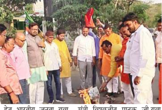
कराने हेतु भारतीय जनता युवा मोर्चा पलामू के द्वारा मुख्यमंत्री हेमंत सोरेन का पुतला दहन कर उनके इस्तीफा का माँग करता है मौके पर उपस्थित थे भारतीय जनता पार्टी के लोकप्रिय जिला अध्यक्ष अमित तिवारी, भाजपा अन्वेषण ब्यूरो (उडक) से जाँच कराने हेतु और इस गंभीर मुद्दे पर विरोध दर्ज

संवाददाता मेदिनीनगर : पलामू को युवाओं में बहुत ही आक्रोश है की प्रदेश के मुख्यमंत्री पलामू की युवाओं के साथ लगातार खिलवाड़ कर रहे हैं उनके भविष्य के साथ खिलवाड़ कर रहे हैं उत्पाद सिपाही भर्ती परीक्षा पेपर लीक प्रकरण को लेकर जनमानस में आक्रोश है अभी तक झारखण्ड में सभी परीक्षाओं में पेपर लीक कर राज्य के युवाओं के भविष्य से खिलवाड़ किया जा रहा है विगत दिनों उत्पाद सिपाही के दौड़ में 20 युवाओं का जान झारखण्ड सरकार के गलत रवैया के कारण चला गया था इन सभी घटनाओं को केंद्रीय अन्वेषण ब्यूरो (उडक) से जाँच कराने हेतु और इस गंभीर मुद्दे पर विरोध दर्ज