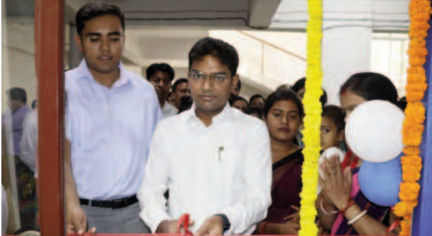
लिए खेल-कूद की सामग्री, पेयजल, पोषण युक्त आहार, विश्राम की व्यवस्था, स्वच्छ शौचालय एवं साफ-सफाई की समुचित व्यवस्था सुनिश्चित की गई है। साथ ही बच्चों की