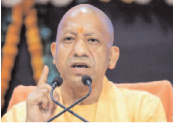
शाम 4:30 बजे पहुंचेंगे। मुख्यमंत्री आज शहरी विस्तारीकरण/ नए शहर प्रोत्साहन योजना के अंतर्गत आगरा विकास प्राधिकरण द्वारा 5,142 करोड़ से आगरा के एम्सादपुर क्षेत्र के

324 विभिन्न परियोजनाओं का भी शिलान्यास एवं लोकार्पण भी मुख्यमंत्री करेंगे। मुख्यमंत्री योगी करीब 4:30 बजे सांय हेलीकॉप्टर से रायपुर रहनकला कार्यक्रम स्थल पर पहुंचेंगे। इस दौरान मुख्यमंत्री टाउनशिप के मांडल का अवलोकन करने के साथ-साथ एक विशाल जनसभा को भी संबोधित करेंगे। मुख्यमंत्री इस कार्यक्रम से पहले दोपहर करीब 2:15 बजे लखनऊ से वायुयान द्वारा आगरा खेरिया सिविल एयरपोर्ट पर आएंगे और वहां से हेलीकॉप्टर द्वारा वृंदावन के लिए प्रस्थान कर जाएंगे। वृंदावन में जगतगुरु मलुक दास जयंती कार्यक्रम में भाग लेने के बाद हेलीकॉप्टर से आगरा में सीधे शिलान्यास स्थल रायपुर/ रहनकला