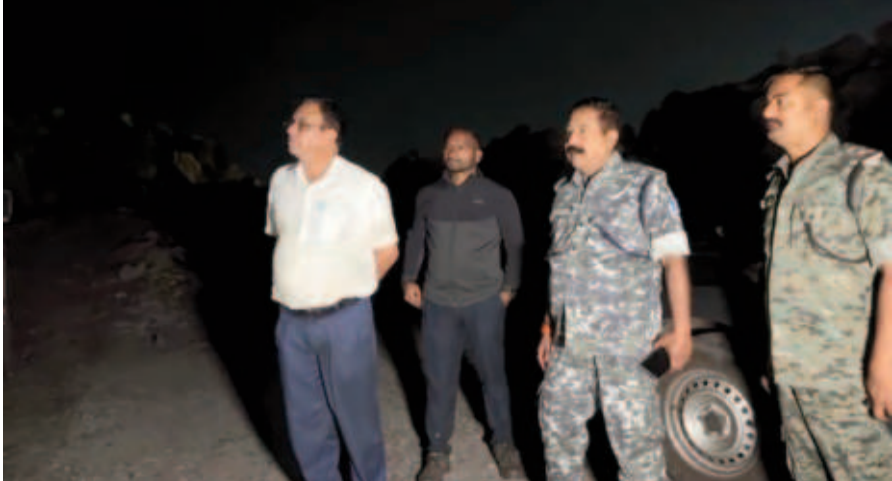
कोयला को लोड करने की तैयारी चल रही थी कि तभी सीसीएल गिरिडीह एरिया के

संवाददाता गिरिडीह : सीसीएल कोलियरी के माईस और बंद कोलियरी क्षेत्र से अवैध खनन कर कोयला की चोरी फिर परिवहन करना आम बात रही है। हर रात को कोयला चोर बाइक समेत सीसीएल के कबरीबाद इलाका में पहुंचते हैं। फिर से यहां चोरी या अवैध खनन कर रखे गए कोयला को लादकर निकल जाते हैं। सोमवार की रात भी इसी तरह की हरकत हो रही थी। रात में दर्जनों चोर बाइक लेकर माईस एरिया पहुंचे थे। यहां सुरंग से कोयला निकालने के बाद