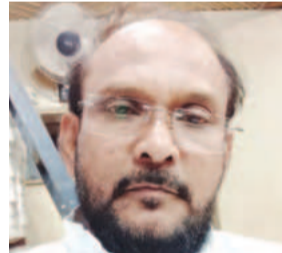
खींचतान चल रही है, वह किसी के लिए भी फायदेमंद नहीं है।

रांची : जिन्दगी बहुत छोटी है—ना किसी से नाराज होकर जीना सही है, ना किसी को नाराज करके। असल खुशी तो इसी में है कि हम सबको साथ लेकर चलें और अपने दिल में मोहब्बत और अपनापन बनाए रखें। जब हम एक-दूसरे को समझते हैं और सम्मान देते हैं, तभी समाज में सच्ची शांति और तरक्की आती है। आज जो आपसी मतभेद और