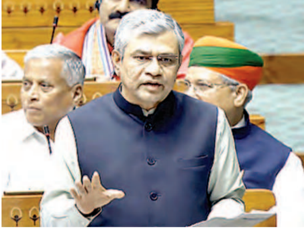
यात्री सुविधाओं में सुधार और स्टेशनों के आधुनिकीकरण के लिए आवंटित धन का प्रभावी उपयोग करने के निर्देश

भौंड प्रबंधन पर जोर देते हुए उन्होंने कहा कि विशेषकर त्योहारों के समय यात्रियों को बिना किसी असुविधा के प्लेटफॉर्म तक पहुंचने और ट्रेन में सवार होने की सुविधा मिलनी चाहिए। उन्होंने यात्री सुविधा और पहुंच को बेहतर बनाने के लिए योजनाओं को प्राथमिकता देने को कहा। बैठक में रेलवे परिवारजनों के लिए लॉबित भूमि अधिग्रहण के मुद्दे पर भी