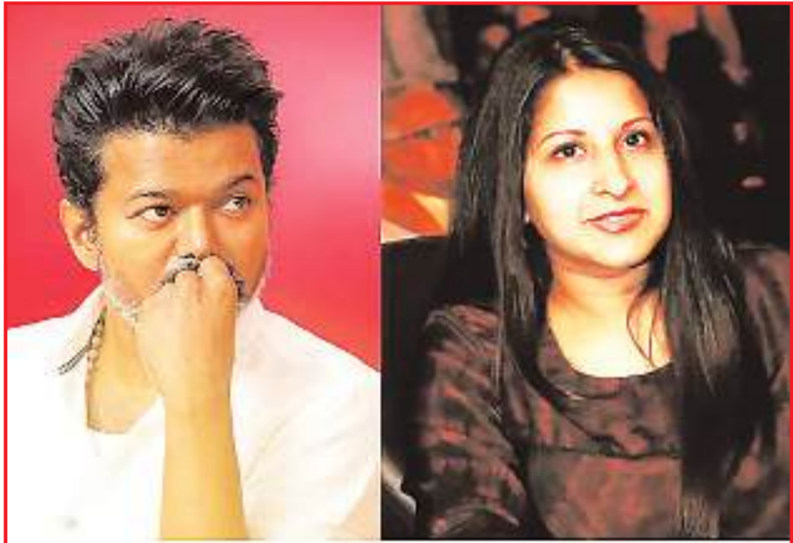
साउथ सुपरस्टार विजय को लगा बड़ा झटका