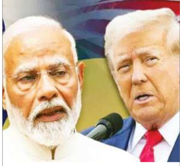
उल्लेखनीय है कि अमेरिका के राष्ट्रपति डोनाल्ड ट्रंप ने यूक्रेन पर रूस के हमले के बाद रूसी तेल पर पाबंदी लगा दी, जिससे खरीदारों को दूसरे विकल्प ढूँढने पड़े थे। भारत रूस ऊर्जा का एक बड़ा खरीददार है और अमेरिका ने भारत पर दबाव डाला है कि वह हमले के लिए रूस से तेल खरीदने को रोकें।

एजेंसी/ वाशिंगटन: अमेरिका ने भारत को रूस से तेल खरीदने के लिए कुछ समय के लिए पाबंदियों पर ढील दे दी है। बीबीसी की रिपोर्ट के अनुसार अमेरिका के वित्त मंत्रालय ने कुछ समय के लिए पाबंदियों में ढील दी है, ताकि भारत समुद्र में फंसे रूसी तेल को खरीद सके। अमेरिका के वित्त मंत्री स्कॉट बेसेंट ने कहा है कि 30 दिन की छूट से वैश्विक बाजार में तेल की आवाजाही बनी रहेगी, ईरान की आवाजाही बनी रहेगी, ईरान को दबाव को कम किया जा सकेगा। श्री बेसेंट ने सोशल मीडिया एक्स पर कहा कि यह कदम एक जानबूझकर उठाया गया अल्पकालीन है, जिससे रूसी सरकार को कोई खास वित्तीय फायदा नहीं होगा, क्योंकि इसमें सिर्फ वही तेल शामिल है, जो पहले से समुद्र में फंसा हुआ है।