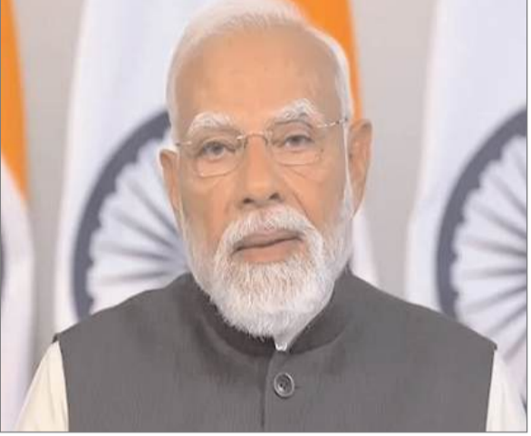
प्रधानमंत्री मोदी ने एक्स पर हिंदी में लिखा कि आत्मविश्वास

नई दिल्ली : प्रधानमंत्री मोदी ने कहा है कि आत्मविश्वास वह शक्ति है, जो हर लक्ष्य को संभव बनाती है और विकसित भारत के संकल्प को साकार करने में अहम भूमिका निभाएगी। प्रधानमंत्री ने मंगलवार को सोशल मीडिया प्लेटफॉर्म एक्स पर यह विचार साझा किए। प्रधानमंत्री का यह संदेश ऐसे समय में आया है, जब कुछ ही घंटे पहले भारत और अमेरिका के बीच एक अहम व्यापार समझौते पर सहमति बनी है। इस समझौते के तहत अमेरिका भारतीय उत्पादों पर लगाए जाने वाले पारस्परिक टैरिफ को 25 प्रतिशत से घटाकर 18 प्रतिशत करने पर राजी हुआ है।