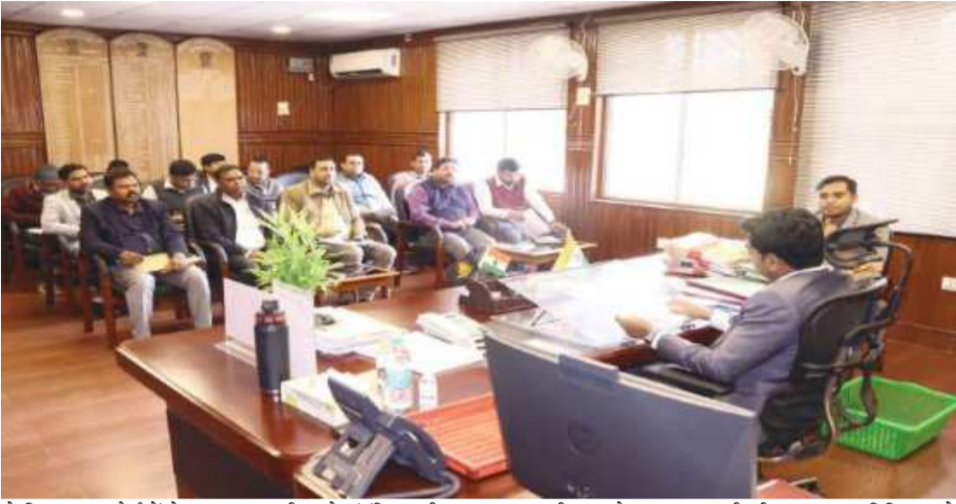
को नियमानुसार बोर्ड में भेजा जाए। सामग्री से संबंधित सभी आवश्यक सामग्री प्राप्त हो चुकी है। साथ ही मतदान दलों के लिए खाद्य सामग्री की उपलब्धता सुनिश्चित करने तथा पोलिंग पार्टी का रूट प्लान पूर्व से