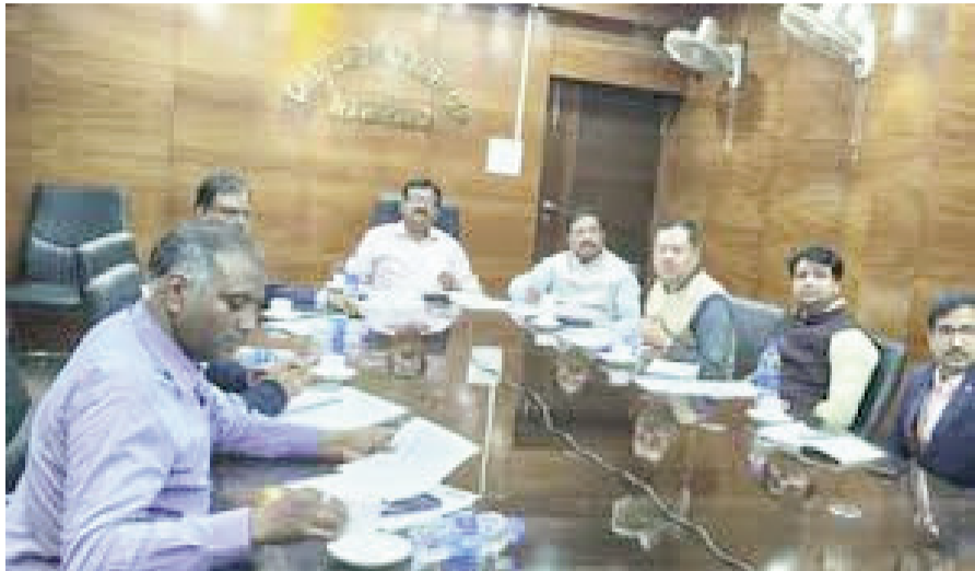
संबंधित बीएलओ बीएलओ एप के माध्यम से फोटो लेकर उसे अपलोड करें।