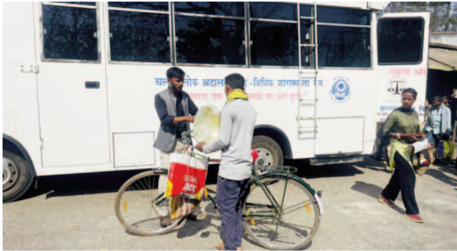
सहायता संबंधी विस्तृत जानकारी प्रदान की गई। अभियान के दौरान कुल 12

हूजस्टिस ऑन व्हील्स के माध्यम से जगन्नाथपुर प्रखंड कार्यालय परिसर एवं साप्ताहिक हाट क्षेत्र में विधिक जागरूकता अभियान संचालित किया गया। कार्यक्रम का शुभारंभ जगन्नाथपुर प्रखंड कार्यालय परिसर से किया गया, जहाँ अंचल पदाधिकारी, जगन्नाथपुर द्वारा मोबाइल वाहन जस्टिस ऑन व्हील्स के द्वारा सरकारी योजनाओं की जानकारी प्रदान की गई, इसके पश्चात वैन जगन्नाथपुर साप्ताहिक हाट भी पहुँची, जहाँ आमजनों को लोक अदालत, विवादों के समाधान में मध्यस्थता के लाभ और प्राधिकार के द्वारा प्रदत्त नि:शुल्क विधिक