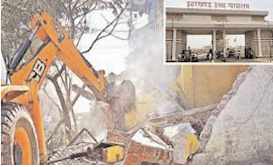
चल रहा बुलडोजर के पास 48 डिसमिल भूईहरी की सुबह करीब 11 बजे से तोड़ने रांची के सुखदेवनगर थाना प्रकृति की जमीन पर बने 12 कांस्ट्रक्शन शिव दुर्गा मंदिर मकानों को मंगलवार 10 फरवरी

भारी पुलिस बल, हेहल सीओ और सीआई भी मौजूद थे। कार्रवाई शुरू होते ही इलाके में अफरा-तफरी का माहौल बन गया।