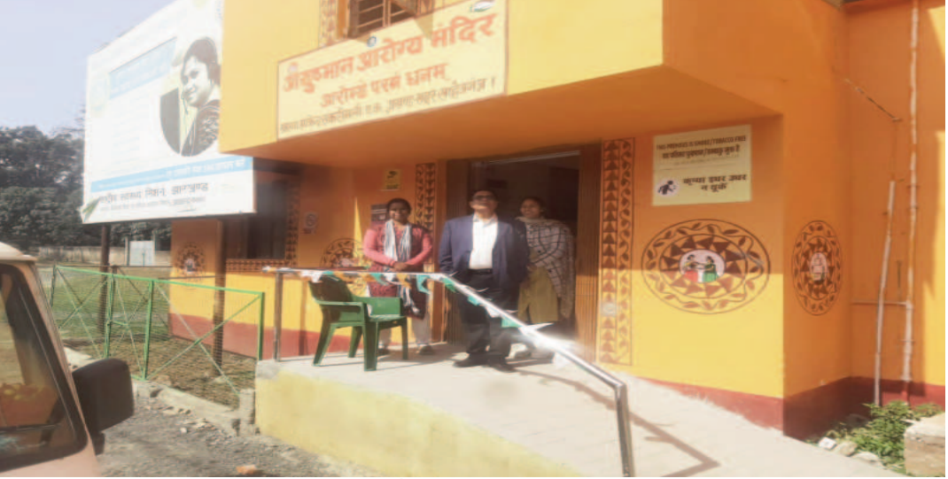
उपलब्धता, डायग्नोस्टिक सेवाओं की स्थिति और आवश्यक सेवाओं की समीक्षा शामिल रही। साथ ही संबंधित

संवाददाता साहिबगंज : सिविल सर्जन साहिबगंज द्वारा जिले के एएनएम सकरीगली एफपी, सकरीगली, मदनशाही एवं लोहंडा स्वास्थ्य संस्थानों का अचेक निरीक्षण किया गया। निरीक्षण के दौरान संबंधित स्वास्थ्य संस्थानों में स्थापित सभी कर्मियों की उपस्थिति की जांच की गई। साथ ही आसपास के स्थानीय नागरिकों से कर्मियों की नियमित उपस्थिति व स्वास्थ्य सेवाओं की उपलब्धता के संबंध में जानकारी प्राप्त की गई। यह भी जांचा गया कि कर्मियों की उपस्थिति नियमित रूप से बनी रहती है। अथवा नहीं इसके अतिरिक्त आयुष्मान आरोग्य मंदिर में प्रदान की जा रही स्वास्थ्य सेवाओं के सभी पहलुओं का विस्तृत अवलोकन किया गया। जिसमें दवा की