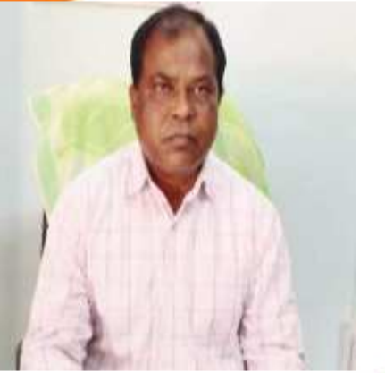
संत बियानी हाई स्कूल लचरगाढ़

गणतंत्र दिवस की हार्दिक शुभकामनाएं व बधाई