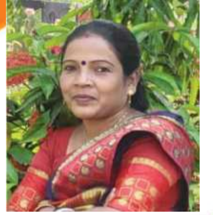
दुतामी हेमरोम प्रखंड प्रमुख कोलेबिरा

गणतंत्र दिवस की हार्दिक शुभकामनाएं व बधाई