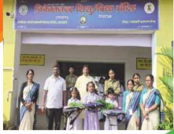
विवेकानंद शिशु मंदिर स्कूल लचरगाढ़

गणतंत्र दिवस की हार्दिक शुभकामनाएं व बधाई