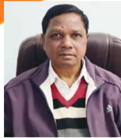
आरसी मध्य विद्यालय लचरगाढ़

गणतंत्र दिवस की हार्दिक शुभकामनाएं व बधाई