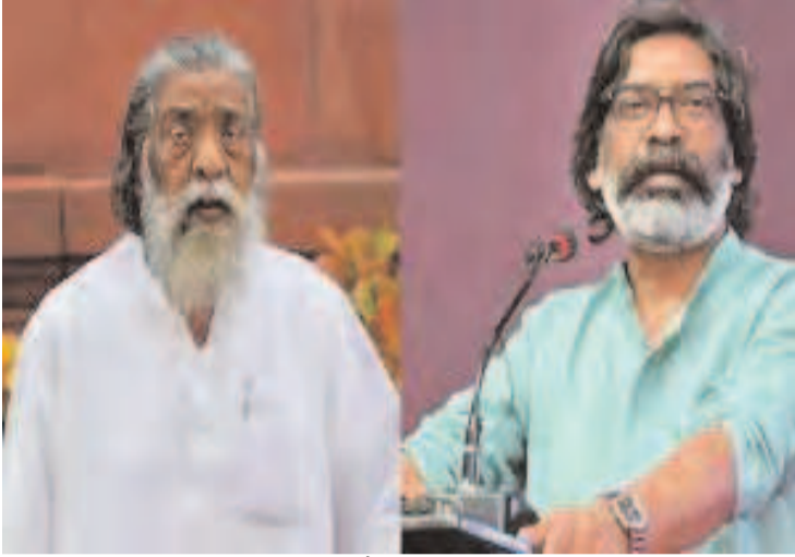
झारखंड की समस्त जनता की ओर से मैं केंद्र सरकार का हार्दिक आभार जताता हूँ।

शिबू सोरेन का जीवन राजनीतिक सीमाओं से कहीं परे, अनंत तक जाता है: शिबू सोरेन का नाम देश के तीसरे सर्वोच्च नागरिक सम्मान पद्म भूषण के लिए चुने गए 13 लोगों में शामिल है। मुख्यमंत्री ने सोशल मीडिया मंच 'पक्स' पर एक पोस्ट में कहा, हम सबके प्रिय, सम्माननीय और आदरणीय बाबा स्व दिशोम गुरुजी शिबू सोरेन को पद्म भूषण सम्मान देने की घोषणा करने के लिए,