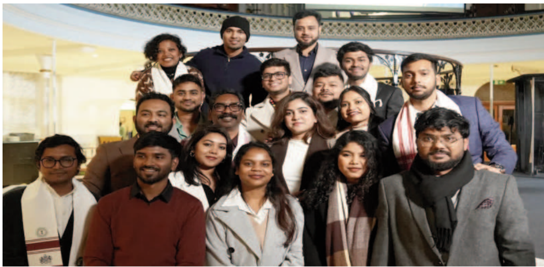
आयोजित किया हो। इस मौके पर मुख्यमंत्री हेमंत सोरेन ने कहा कि झारखंड की विकास यात्रा केवल उपलब्धियों तक सीमित नहीं है, बल्कि यह अनंत संभावनाओं की ओर बढ़ने की कहानी है, जहां विकास और प्रकृति के बीच संतुलन सबसे अहम है। उन्होंने कहा कि मरग गोमके जयपाल सिंह मुंडा और बाबा दिशोम गुरुजी के विचार, गरिमा,

लंदन/रांची : झारखंड के 25 वर्ष पूरे होने के अवसर पर लंदन में आयोजित झारखंड @25 कार्यक्रम में राज्य की संघर्षपूर्ण यात्रा, सांस्कृतिक विरासत और भविष्य की संभावनाओं की झलक देखने को मिली। मुख्यमंत्री हेमंत सोरेन के नेतृत्व में हुए इस कार्यक्रम में यूनाइटेड किंगडम में पढ़ रहे और कार्यरत झारखंड के युवाओं, शिक्षाविदों, शोधकर्ताओं और उद्यमियों ने उत्साहपूर्वक भाग लिया। कार्यक्रम में मारग गोमके ओवरसीज स्कॉलरशिप योजना और चैवनींग मरग गोमके स्कॉलर्स के तहत यूके की विभिन्न यूनिवर्सिटीज में पढ़ाई कर रहे छात्र-छात्राओं सहित कुल लगभग 150 प्रतिभागी शामिल हुए। यह भारत में संभवतः पहला मौका है जब किसी राज्य सरकार ने विदेश में अपने छात्रों, प्रवासियों और उद्यमियों के लिए ऐसा कार्यक्रम