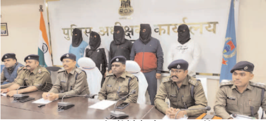
एसपी ने दी जानकारी

राधिका होटल दुमका-रामपुरहाट मुख्य मार्ग ठल 114अ पर मुफरिसल थाना क्षेत्र में अवस्थित है। थाने में किए गए एफआईआर में होटल मालिक को पांच लाख की रंगदारी मांगने और जान से मारने के प्रयास में गोली चलाने की बात कही थी।