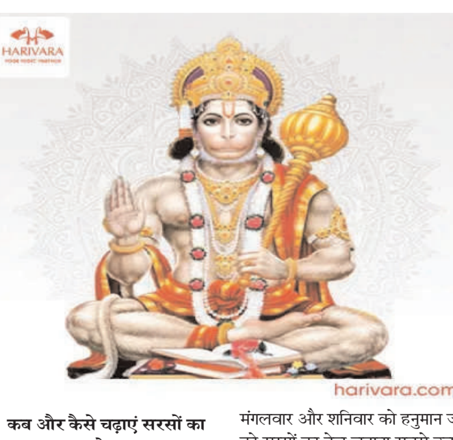
कब और कैसे चढ़ाएं सरसों का तेल

लो हनुमान जी की पूजा में चमेली के तेल और सिंदूर का प्रयोग किया जाता है। लेकिन क्या आप जानते हैं कि शनिदेव की तरह हनुमान जी को भी सरसों का तेल अर्पित किया जाता है। बता दें कि हनुमान जी को सरसों का तेल चढ़ाने का विशेष महत्व होता है। यह उपाय उन लोगों के लिए अधिक फायदेमंद होता है, जो शनि की साड़ेसाती या दैट्या से परेशान हैं। माना जाता है कि हनुमान जी को सरसों का तेल चढ़ाने से शनिदेव की भी कृपा मिलती है और बुरे प्रभावों को कम करते हैं। ऐसे में आज इस आर्टिकल के जरिए हम आपको बताते जा रहे हैं कि हनुमान जी को सरसों का तेल कब और कैसे अर्पित करना चाहिए।