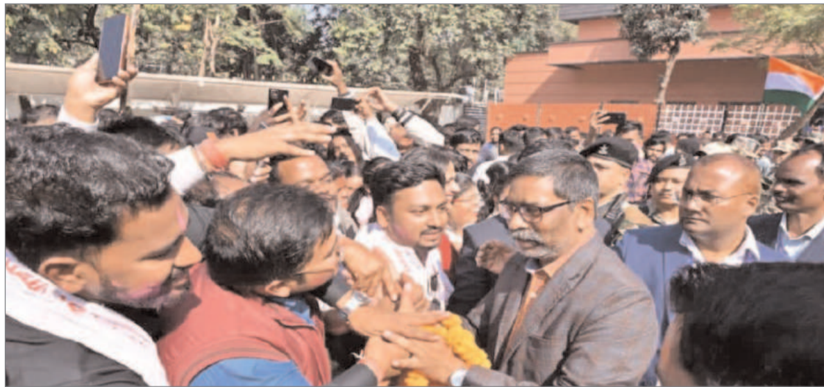
स्नातक स्तरीय प्रतियोगिता परीक्षा को लेकर भी उन्होंने षड्यंत्र रचने का प्रयास किया। मामला उच्च न्यायालय तक पहुंचा। हमारी सरकार ने पूरी निष्पक्षता के साथ इसकी जांच कराई, जिन्होंने इस

सोरेन ने छात्रों को संबोधित करते हुए कहा कि अगर इरादे नेक हो तो हर चीज बेहतर होती है। इसी का परिणाम है कि जेएसएससी की संयुक्त स्नातक स्तरीय प्रतियोगिता परीक्षा के रिजल्ट और नियुक्ति प्रक्रिया से जुड़ी सारी अड़चनें अब दूर हो चुकी हैं। हालांकि, इसमें थोड़ा विलंब हुआ, नहीं तो राज्य सरकार की पहली वर्षगांठ पर आयोजित राज्य स्तरीय समारोह में आपके हाथों में भी नियुक्ति पत्र देने की खुशियां हम सभी मनाते, लेकिन आप सभी को लंबे संघर्ष के बाद मिली सफलता और विजयी होने के लिए बहुत-बहुत शुभकामनाएं। मुख्यमंत्री ने कहा कि इस राज्य में कुछ ऐसे विरोधी तत्व हैं जो हर प्रतियोगिता परीक्षाओं को बाधित करने की साजिश रचते रहते हैं। जेएसएससी संयुक्त