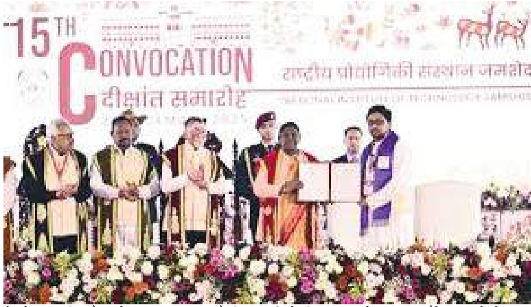
पोस्टग्रेजुएट शामिल हैं। इसके अलावा, एक डी-लिट, एक मानद पीएचडी, दो स्वर्ण पदक और 16 रजत पदक भी उत्कृष्ट शैक्षणिक प्रदर्शन के लिए प्रदान किए गए। राष्ट्रपति मुर्मू ने कहा कि शिक्षा का उद्देश्य केवल अच्छे पैकेज या प्लेसमेंट पाना नहीं है, बल्कि यह भी है कि आपके काम से समाज के कितने लोगों का

संवाददाता रांची/जमशेदपुर : झारखंड दौरे पर राष्ट्रपति द्रौपदी मुर्मू ने सोमवार को कहा कि वर्ष 2047 तक विकसित भारत के लक्ष्य को हासिल करने के लिए शोध, नवाचार और स्टार्टअप संस्कृति को बढ़ावा देना बेहद जरूरी है। यहां राष्ट्रीय प्रौद्योगिकी संस्थान (एनआईटी) के 15वें दीक्षांत समारोह को संबोधित करते हुए राष्ट्रपति ने कहा कि भारत ने 2047 तक विकसित राष्ट्र बनने का लक्ष्य रखा है और इस लक्ष्य को पूरा करने में युवाओं की भूमिका अहम होगी। उन्होंने कहा कि केंद्र सरकार शोध, नवाचार और स्टार्टअप संस्कृति को प्रोत्साहित करने के लिए कई योजनाएं चला रही है। राष्ट्रपति ने कहा कि एनआईटी को शोध और नवाचार पर अधिक ध्यान देना चाहिए, ताकि भारत एक ज्ञान महाशक्ति बन सके। इस वर्ष विभिन्न संकायों में कुल 1,112 छात्रों को डिग्रियां प्रदान की गईं, जिनमें 722 स्नातक, 303 अंडरग्रेजुएट और 78