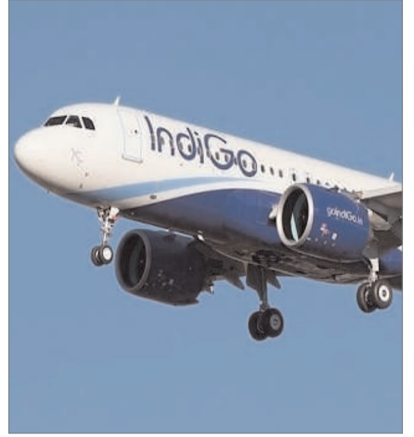
के बाद विमान को अलग पार्किंग क्षेत्र (आइसोलेशन बे) में ले जाकर सुरक्षा जांच शुरू कर दी गई है। बम निरोधक दस्ते, सीआईएसएफ और अन्य सुरक्षा एजेंसियां विमान की पूरी तरह से जांच कर रही हैं। शुरुआती जांच में अब तक किसी भी संदिग्ध वस्तु या विस्फोटक का पता नहीं चला है।

बताया गया कि मंगलवार सुबह इंडिगो की यह उड़ान हैदराबाद के राजीव गांधी अंतरराष्ट्रीय हवाई अड्डे से कुवैत के लिए रवाना हुई थी। उड़ान के बाद मिले ईमेल में बम की मौजूदगी का दावा किया गया, जिसके आधार पर एयर ट्रेफिक कंट्रोल ने विमान को तुरंत डायवर्ट कर आपात लैंडिंग कराई। विमान सुरक्षित उतर चुका है और सभी यात्रियों को सुरक्षित बाहर निकाल लिया गया है। यात्रियों को आगे की यात्रा के लिए वैकल्पिक व्यवस्था उपलब्ध कराई जा रही है। अधिकारियों के मुताबिक, लैंडिंग