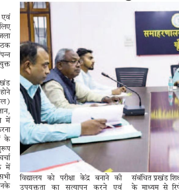
विद्यालय को परीक्षा केंद्र बनाने की उपयुक्तता का सत्यापन करने एवं संबंधित प्रखंड शिक्षा प्रसार पदाधिकारियों के माध्यम से रिपोर्ट प्रस्तुत करने को कहा गया था। आज की बैठक में विभिन्न प्रखंडों से प्राप्त इन रिपोर्टों की