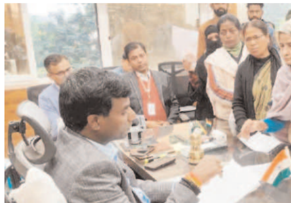
उन्होंने यह भी कहा कि जनता दरबार का उद्देश्य लोगों को राहत देना और एक ही जगह पर उनकी समस्याओं का तुरंत समाधान करना है। शिकायतों के समाधान में संवेदनशीलता, पारदर्शिता और जवाबदेही जरूरी है।

उपायुक्त ने हर शिकायत को गंभीरता से सुना और मौके पर मौजूद अधिकारियों को तुरंत कार्रवाई करने के निर्देश दिए। उन्होंने साफ कहा कि किसी भी शिकायत को बिना वजह लंबित रखना बर्दाश्त नहीं किया जाएगा। सभी विभाग तय समय सीमा के भीतर रिपोर्ट दें और जरूरत पड़ने पर स्थल निरीक्षण भी करें।