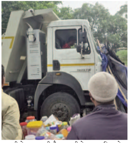
खराबी के कारण ही है या गाड़ी के आत्याधिक तेज गति के कारण या ड्राइवर नसे में था इस पर भी जांच हो रही है। वहीं जिस दुकानदारों को नुकसान उठाना पर है उन्होंने अपने नुकसान की भरपाई की मांग की है ताकि वो दुकान की दुबारा मर्ममत कर अपनी जीवन यापन कर सके। इस घटना ने एक बार फिर राज्य राजमार्गों पर वाहनों की अनियंत्रित गति और सुरक्षा उपायों की कमी को लेकर सवाल खड़े किए हैं।