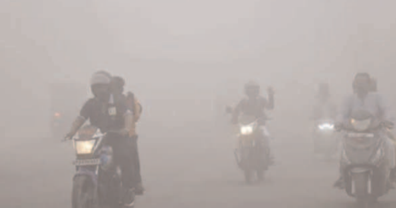
डिग्री सेल्सियस रिकॉर्ड किया गया। पूर्वी सिंहभूम के बहरागोड़ा में सबसे अधिक न्यूनतम तापमान 15.16 डिग्री सेल्सियस दर्ज किया गया। तापमान में 4-5 डिग्री की गिरावट आने की संभावना:

झारखंड के अधिकांश हिस्सों में पिछले 24 घंटे के दौरान न्यूनतम तापमान 10 डिग्री सेल्सियस से अधिक दर्ज रिकॉर्ड किया गया। सबसे कम न्यूनतम तापमान गुमला में 10 B