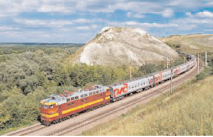
23 दिसंबर से 7 जनवरी तक रह रहे वाली ट्रेनें ट्रेन नंबर 18085/18086 रेलगाड़ी संख्या 13303/13304 खड़गपुर-रांची एक्सप्रेस, धनबाद-रांची एक्सप्रेस, ट्रेन नंबर

रेलगाड़ी संख्या 58665/58666 हटिया-सांकी पैसेंजर, ट्रेन नंबर 18602/18601 हटिया-टाटांगर एक्सप्रेस, रेलगाड़ी संख्या 58663/58664 हटिया-सांकी पैसेंजर, रेलगाड़ी संख्या 58034/58033 रांची-बोकारो स्टील सिटी पैसेंजर 10 दिसंबर से 07 जनवरी तक रह रहेगी।