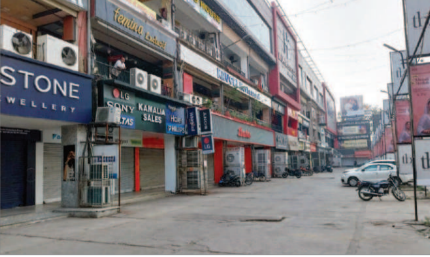
ईडी विदेशी संपत्तियों और उनके कागजी दस्तावेजों की जांच कर

यह झारखंड में विदेशी मुद्रा प्रबंधन अधिनियम (फेमा) और मनी लॉन्ड्रिंग (पीएमएलए) के तहत की गई यह ईडी की पहली छापेमारी है। छापेमारी के दौरान