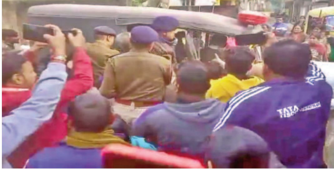
पुलिस के पहुंचने से पहले आरोपी के घर में तोड़फोड़ मृतक के पिता ने बताया कि हम लोगों को