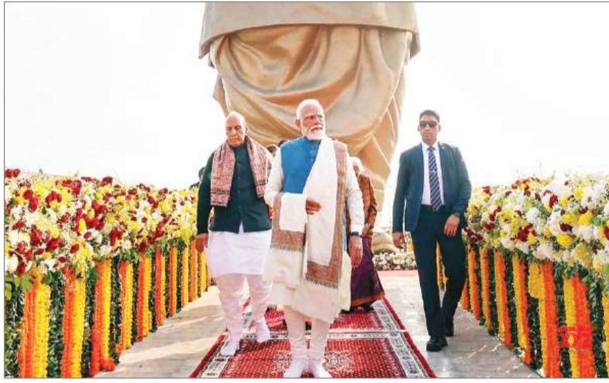
गर्व है कि हमारी सरकार को आर्टिकल 370 की दीवार गिराने का मौका मिला। इसकी बुनियाद

एजेंसी/लखनऊ: राष्ट्र प्रेरणा स्थल के लोकार्पण के मौके पर देश को संबोधित करते हुए प्रधानमंत्री नरेंद्र मोदी ने कहा कि राष्ट्र प्रेरणा स्थल उस सोच का प्रतीक है, जिसने आत्म सम्मान और सेवा का मार्ग दिखाया है। इन महापुरुषों की विशाल प्रतिमाएं इतनी ऊंची हैं, लेकिन इनसे मिलने वाली प्रेरणाएं इनसे भी बुलंद हैं। प्रधानमंत्री ने कहा कि मैं यूपी के साथ पूरे देश को इस आधुनिक प्रेरणा स्थल की बधाई देता हूँ। उन्होंने कहा कि जिस जमीन पर यह बना है, इसमें कई दशकों में कूड़े-कचरे का पहाड़ बना हुआ था। इस प्रोजेक्ट से जुड़े सभी लोगों को बहुत बधाई देता हूँ। इस दौरान उन्होंने कहा कि भाजपा को