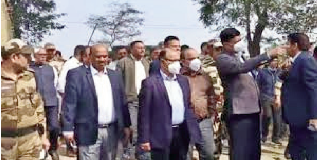
कहीं अधिक है। ग्रामीणों की पीड़ा और स्थानीय ग्रामीणों, विशेषकर महिलाओं ने अपनी परेशानियां साझा कीं और क्षेत्र में विमाइते हालात पर चिंता जताई। चेयरमैन ने कहा कि जांच के दौरान यह स्पष्ट हुआ

संवाददाता रांची : धनबाद के केन्दुआडीह क्षेत्र में पिछले आठ दिनों से जहरीले गैस का रिसाव जारी है, जिससे स्थिति लगातार गंभीर होती जा रही है। बीसीसीएल के तकनीकी दल समस्या पर काबू पाने के प्रयास कर रहे हैं, लेकिन अब तक गैस रिसाव पूरी तरह नियंत्रित नहीं हो सका है। कई इलाकों में गैस का स्तर खतरनाक सीमा पार कर चुका है। निरीक्षण में सामने आए खतरनाक स्तर: हालात की गंभीरता को देखते हुए कोल इंडिया के चेयरमैन सनोज कुमार झा ने बीसीसीएल अधिकारियों के साथ प्रभावित क्षेत्रों का निरीक्षण किया। निरीक्षण के दौरान एरिया-6 गेस्ट हाउस परिसर में गैस डिटेक्टर मशीन से 2000 पीपीएम जहरीली गैस दर्ज की गई, जबकि मस्जिद पट्टी क्षेत्र में 617 पीपीएम स्तर पाया गया, जो सामान्य मानकों से