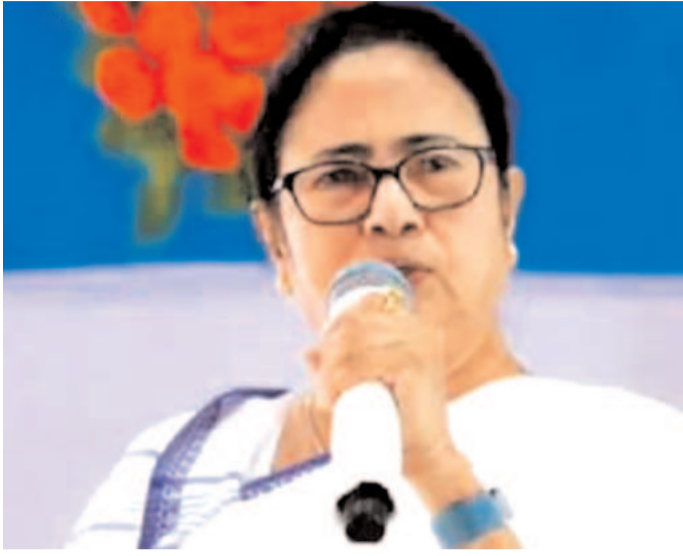
मांगों का निविदा/प्रक्रिया पूर्ण हो चुकी है तथा शेष प्रक्रियाधीन है। सम्पूर्ण जिले में इन सभी सड़कों का शिलान्यास मुख्यमंत्री द्वारा ही किया जाएगा। प्राप्त जानकारी के अनुसार पथश्री/चतुर्थ चरण के अंतर्गत सड़क/निर्माण तीन स्तरों पर किया