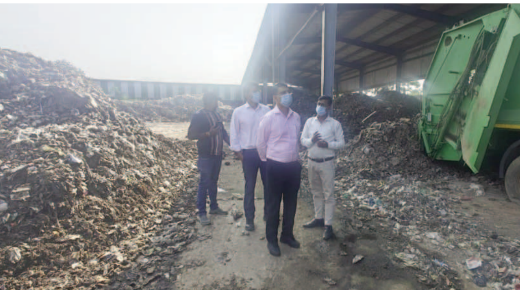
आयुक्त ने स्पष्ट निर्देश दिया कि सात दिनों के भीतर फ्लन्नट का पूर्ण निष्पादन सुनिश्चित किया जाए। उन्होंने कहा कि कचरा प्रबंधन व्यवस्था में किसी भी प्रकार की लापरवाही बर्दाश्त नहीं की जाएगी, क्योंकि यह स्वच्छता रैंकिंग को

संवाददाता देवघर : देवघर नगर निगम के नगर आयुक्त ने शुक्रवार को सहायक नगर आयुक्त एवं नगर प्रबंधक के साथ नगर निगम क्षेत्र अंतर्गत संचालित सॉलिड वेस्ट मैनेजमेंट प्लांट का औचक निरीक्षण किया। निरीक्षण के दौरान नगर आयुक्त ने प्लांट की कार्यप्रणाली, कचरा प्रोसेसिंग की स्थिति तथा स्वच्छता से संबंधित विभिन्न बिंदुओं की विस्तारपूर्वक समीक्षा की। निरीक्षण में पाया गया कि दिए गए लक्ष्य का लगभग 60 प्रतिशत कार्य ही पूर्ण किया जा सका है, जबकि शेष 40 प्रतिशत कार्य अभी लंबित है। इस पर नगर आयुक्त ने प्लांट के पदाधिकारियों को सख्त निर्देश दिया कि शेष कार्य को आगामी एक सप्ताह के भीतर हर हाल में पूरा किया जाए। इसके साथ ही के डिस्पोजल कार्य की धीमी प्रगति पर असंतोष जताते हुए नगर