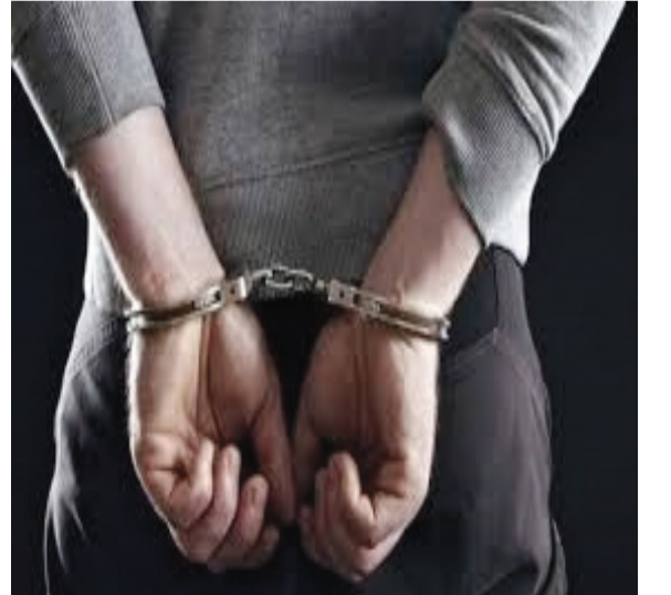
मोटर फिट करने के लिए अदेगा पंचायत बुलाया गया था। दोपहर के भोजन के बाद काम पर लौटते समय, उन्हें 9-10 लोगों ने रोक लिया, जिन्होंने पानी की पंप के पुर्जे चुराने का आरोप लगाते हुए उनकी पिटाई की। सूचना मिलने के बाद, पुलिस घायल व्यक्ति को कोलेबिरा के सामुदायिक स्वास्थ्य केंद्र ले गई और बाद में उसे थाने ले आई। अधिकारी ने बताया कि अगले दिन सुबह मुखिया के हस्तक्षेप के बाद उसे छोड़ दिया गया।