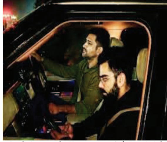
अप्रोका के खिलाफ वनडे सीरीज खेलने रांची पहुंची है, और यह मुलाकात उसी दौरान हुई। विराट के अलावा कई और खिलाड़ी भी धोनी से मिलने उनके घर पहुंचे। इनमें ऋषभ पंत और ऋतुराज गायकवाड़

रांची : राजधानी रांची में गुरुवार देर रात भारतीय क्रिकेट फैंस के लिए एक दिल छू लेने वाला पल देखने को मिला। एक वायरल वीडियो में पूर्व भारतीय कप्तान महेंद्र सिंह धोनी अपने पुराने साथी और स्टार बल्लेबाज विराट कोहली के साथ अपनी कार में झड़व करते हुए नजर आए। जैसे ही वीडियो सोशल मीडिया पर आया, यह मिन्टों में वायरल हो गया और फैंस ने इसे 'री-यूनियन ऑफ द ईयर' कहना शुरू कर दिया। अक्सर जब टीम इंडिया रांची में मैच खेलने आती है, तब क्रिकेटर धोनी के घर पहुंचते हैं, और यह परंपरा इस बार भी जिंदा रही। भारतीय टीम दक्षिण