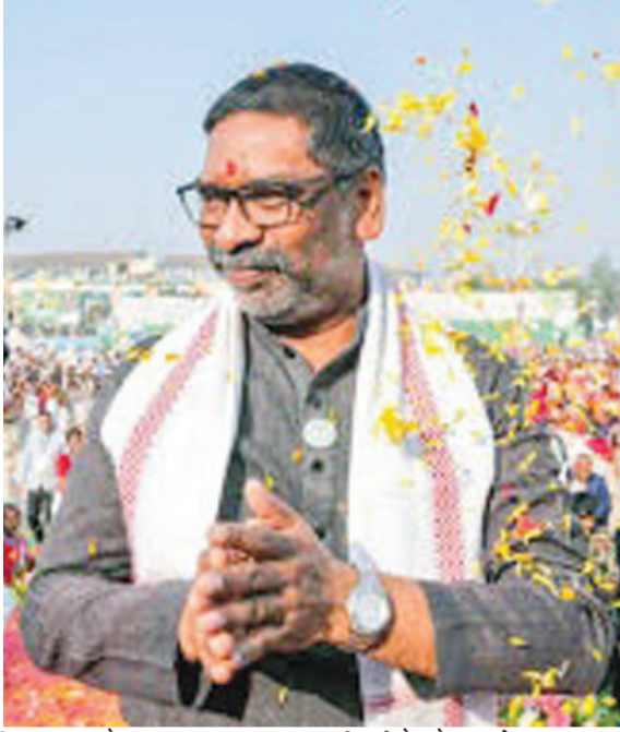
किया गया है, जहां लगभग 50 हजार लोगों के बैठने की व्यवस्था

रांची : झारखंड सरकार के एक वर्ष का कार्यकाल पूरा होने के मौके पर शुक्रवार को राज्य के 10 हजार युवाओं को रोजगार का बड़ा अवसर मिलने जा रहा है। इस मौके पर आयोजित भव्य समारोह में मुख्यमंत्री हेमंत सोरेन स्वयं मौजूद रहकर चयनित युवाओं को नियुक्ति पत्र सौंपेंगे। इसमें सरकारी विभागों के साथ-साथ निजी कंपनियों में चयनित आवेदकों को भी नौकरी दी जाएगी। राज्य के विभिन्न जिलों से हजारों की संख्या में युवा रांची पहुंच रहे हैं। नियुक्ति पत्र मिलने की खुशी उनके चेहरों पर साफ दिख रही है और वे इसे अपने सपनों को साकार करने की दिशा में एक बड़ा कदम मान रहे हैं। यह कार्यक्रम ऐतिहासिक मोरहाबादी मैदान में आयोजित