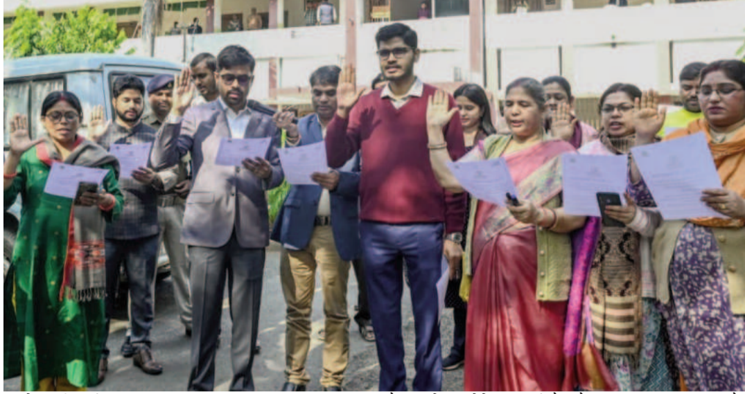
इससे जुड़ी कई कूप्रथाएं मिलकर एक निवारण आवश्यक हैं। आगे उन्होंने बुराई है और कानून का उल्लंघन है, विकट समस्या बनाते हैं, जिसका कहा कि बाल विवाह एक सामाजिक जो बालिकाओं की शिक्षा, सुरक्षा,