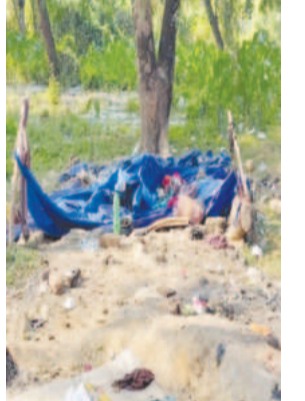
बतायी जा रही है। क्योंकि दोनों इस कड़ाके की ठंड में मात्र एक प्लास्टिक के नीचे अपना सिर छुपा कर रह रहे थे। रात में बढ़ती ठंड में भी इन्हें राहत नहीं मिली। खबर लिखे जाने तक दोनों की पहचान फिलहाल नहीं हो पायी है।