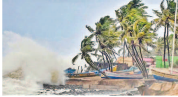
सेन्यार के बाद अब बंगाल की खाड़ी में बना नया चक्रवात दितवाह, राज्यों में भारी बारिश का अलर्ट

नई दिल्ली : श्रीलंका में लगातार हो रही भारी बारिश और भूस्खलन के चलते हालात काफी बिगड़ चुके हैं। देशभर में अब तक 56 लोगों की मौत हो चुकी है। वहीं, 600 से ज्यादा घरों को भारी नुकसान पहुंचा है। बिगड़ते हालात को देखते हुए सरकार ने शुक्रवार को सभी सरकारी दफतरो और स्कूलों को बंद रखने का निर्णय लिया। बता दें कि पिछले सप्ताह से ही श्रीलंका खराब मौसम से जूझ रहा है। हालांकि, गुरुवार को मूसलाधार बारिश ने यहां तबाही मचा दी। तेज बारिश के कारण कई जगह घर, सड़कें और खेत पानी में डूब गए। इसके चलते कई इलाकों में भूस्खलन की घटनाएं सामने आईं। सरकार के मुताबिक, सबसे ज्यादा तबाही बंदुल्ला और नुवारा एलिया के पहाड़ी चाय उत्पादन क्षेत्रों में दिखी, जहां गुरुवार को ही 25