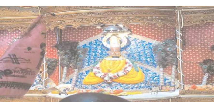
होते हुए पुरुषोत्तम गली बाबा श्याम मंदिर पहुंची इस पावन अवसर पर श्याम बाबा के रथ

साहिबगंज: देवउठनी एकादशी और खाटवाले श्याम बाबा के अवतरण दिवस पर सर्वापेक्षित सभी श्याम प्रेमियों चौक बाजार स्थित बाबा डाकिनारा महादेव मंदिर से बाबा का निशान को हाथों में लेकर राजस्थानी परिवेश में महिलाएं पुरुष सभी ढोल नगाड़ों के साथ बाबा श्याम की जय जयकार करते झूमते नाचते हुए शोभायात्रा शहर के चौक बाजार, बाटारोड, गुडबाजार, गोपालपुर