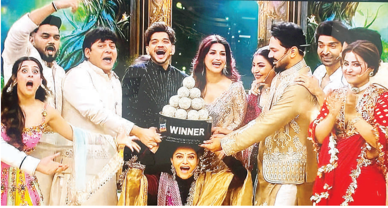
'पति, पत्नी और पंगा' विनर