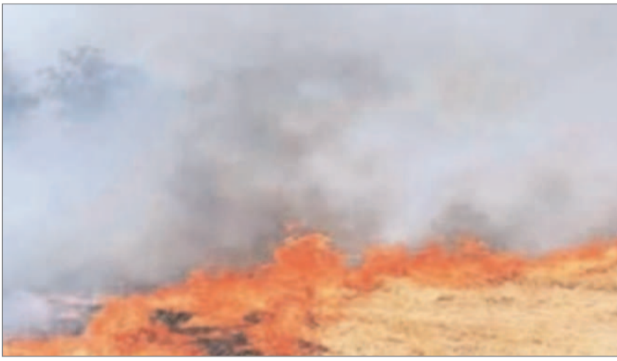
संवाददाता गुमला: जिले में आग लगने की दो अलग-अलग अत्यंत दुखद घटनाओं में दो मासूम बच्चों की झुलसकर मौत हो गई। दोनों बच्चों को गंभीर रूप से झुलसी हुई अवस्था में बेहतर इलाज के लिए रिस्स