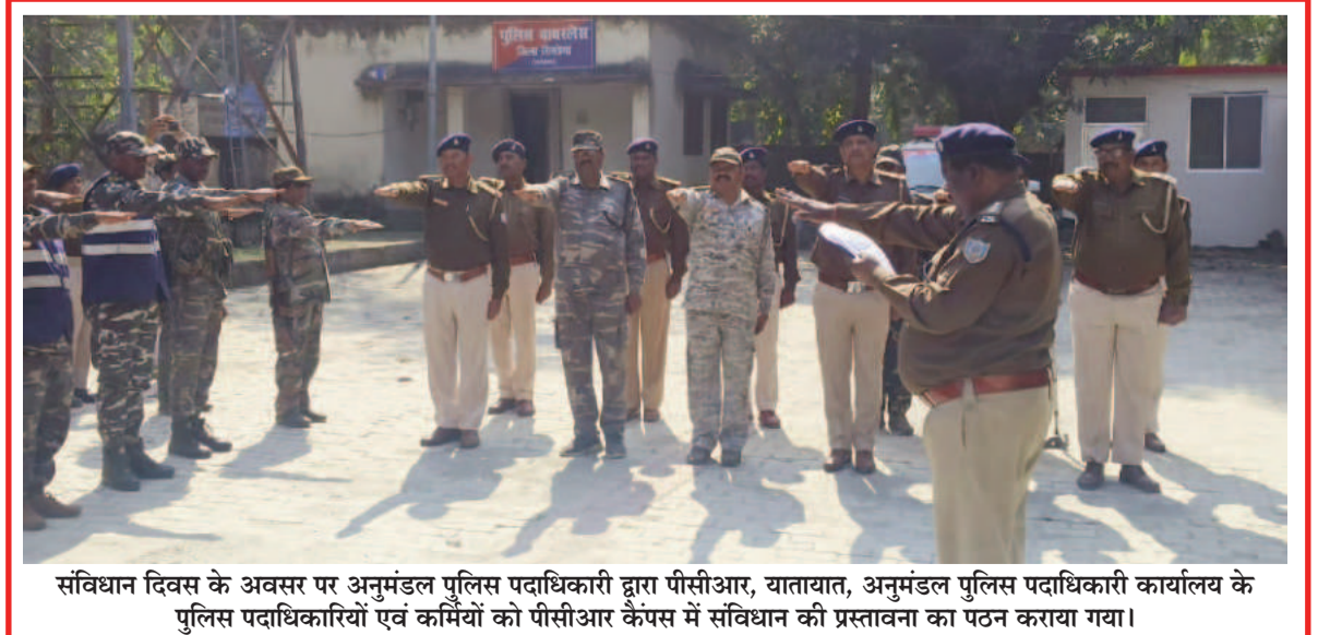
संविधान दिवस के अवसर पर अनुमंडल पुलिस पदाधिकारी द्वारा पीसीआर, यातायात, अनुमंडल पुलिस पदाधिकारी कार्यालय के पुलिस पदाधिकारियों एवं कर्मियों को पीसीआर कैंपस में संविधान की प्रस्तावना का पठन कराया गया।