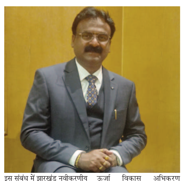
इस संबंध में झारखंड नवीकरणीय ऊर्जा विकास अभिकरण