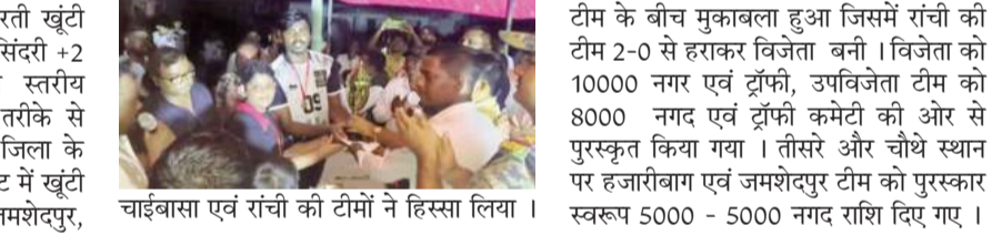
चाईबासा एवं रांची की टीमों ने हिस्सा लिया।

संवाददाता खूंटी : भगवान बिरसा मुंडा की धरती खूंटी जिले के सिंदरी गांव में शुक्रवार को सिंदरी +2 विद्यालय मैदान में 28वें राज्य स्तरीय वॉलीबॉल प्रतियोगिता का शानदार तरीके से आयोजन किया गया। जिसमें आठ जिला के टीमों के बीच खेला गया। इस टूर्नामेंट में खूंटी, धनबाद, बोकारो, हजारीबाग, जमशेदपुर,