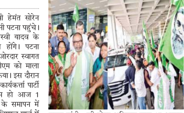
राहुल गांधी की वोटर अधिकार यात्रा 17 अगस्त को सासाराम से शुरू हुई थी। इसके बाद से अब तक यह यात्रा मुजफ्फरपुर, दरभंगा, सुपौल, पूर्णिया समेत कई जिलों से होकर गुजरी है।

संवाददाता रांची/पटना: झारखंड के मुख्यमंत्री हेमंत सोरेन आज सोमवार को बिहार की राजधानी पटना पहुंचे। यहां सीएम राहुल गांधी और तेजस्वी यादव के वोटर अधिकार यात्रा में शामिल होंगे। पटना एयरपोर्ट पर पहुंचते ही सीएम का जोरदार स्वागत हुआ। जेएम्एम कार्यकर्ताओं ने सीएम को माला पहनाकर और बूके देकर स्वागत किया। इस दौरान एयरपोर्ट पर बड़ी संख्या में ज्ञानमो कार्यकर्ता पार्टी का झंडा लिए नजर आये। मालूम हो आज 1 सितंबर को वोटर अधिकार यात्रा के समापन में इंडिया गठबंधन के कई प्रमुख नेता विशाल मार्च में शामिल होंगे। इसी क्रम में सीएम हेमंत सोरेन भी पटना पहुंचे हैं। यह यात्रा आज पटना के गांधी मैदान से शुरू होगी। उल्लेखनीय है कि बिहार में