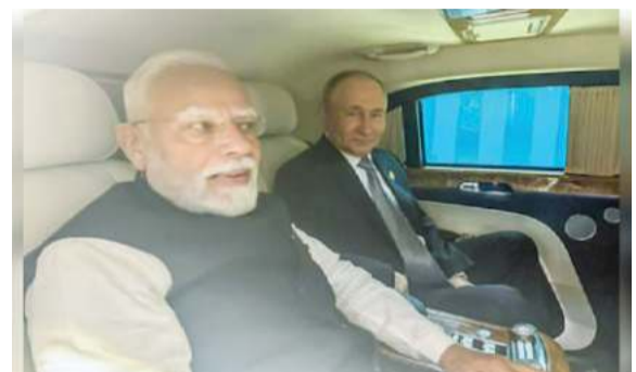
एससीओ समिट में दिखी भारत की धमक : जब मोदी-पुतिन साथ चले तो कोने में खड़े देखते रह गए शहबाज शरीफ

तियानजिन: प्रधानमंत्री नरेंद्र मोदी और रूस के राष्ट्रपति व्लादिमीर पुतिन शंघाई सहयोग संगठन (एससीओ) शिखर सम्मेलन के समापन के बाद द्विपक्षीय बैठक के लिए एक ही कार में सवार होकर मीटिंग में पहुंचे। पीएम मोदी ने सोशल मीडिया प्लेटफॉर्म एक्स पर एक तस्वीर शेयर कर इस मुलाकात की जानकारी दी। पीएम मोदी ने फोटो शेयर करते हुए लिखा, एससीओ शिखर सम्मेलन के बाद मैं और राष्ट्रपति पुतिन साथ में द्विपक्षीय बैठक के स्थान पर गए। उनके साथ बातचीत हमेशा ज्ञानवर्धक होती है। यह मुलाकात दोनों देशों के बीच मजबूत कूटनीतिक संबंधों को दर्शाती है। इससे पहले दिन में, पीएम मोदी, चीनी राष्ट्रपति शी जिनपिंग और राष्ट्रपति पुतिन के बीच अनौपचारिक बातचीत की तस्वीरें सामने आईं, जो एससीओ शिखर सम्मेलन के दौरान तीनों नेताओं के बीच हल्के-फुल्के पल को दर्शाती हैं। इन तस्वीरों में तीनों नेता मुस्कुराते और बातचीत करते नजर आए, जो रूस के कजाख में हुए ब्रिक्स शिखर सम्मेलन की एक समान तस्वीर की याद दिलाती हैं। ताजा तस्वीरों में पुतिन बायें ओर, बीच में प्रधानमंत्री मोदी और दायें ओर शी जिनपिंग एक साथ चलते हुए एससीओ फैमिली फोटो के लिए पोज देते दिखे। इस तस्वीर को साझा करते हुए पीएम मोदी ने एक्स पर लिखा, तियानजिन में मुलाकातें जारी। एससीओ शिखर सम्मेलन के दौरान राष्ट्रपति पुतिन और